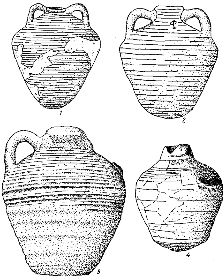
Рис. 1. Візантійська амфорна кераміка:

1 — Воїнь (р. Сула); 2 — Саркель — Біла Вежа; 3 — Жовнині; 4 — Іван-Гора (Ржищів).