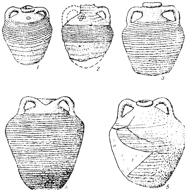
Рис. 2. Візантійська амфорна кераміка:

1 — амфора IX—X ст. з Свищова (Болгарія); 2 — Діногетія-Гарвен (Болгарія); 3 — амфора IX—X ст. з Попино (Сілістренсько); 4 — Київ; 5 — Бакоярино — Скіфра (Київська обл.).