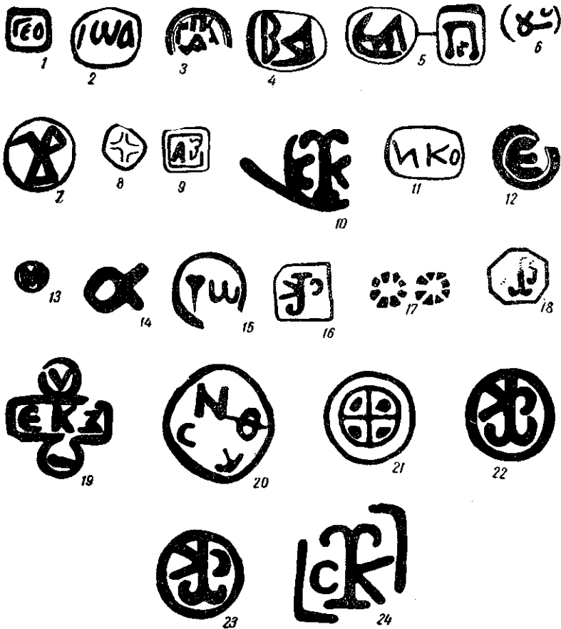
Рис. 3. Амфорні клейма-монограми:

1—9 — на херсонеських амфорах (Північне Причорномор'я); 10—14 — на амфорах з Білої Вежі (Нижній Дон) 15 — на амфорах з Керчі (Північне Причорномор'я); 16, 18 — на амфорах з Діногетії-Гарвен (Болгарія); 17 — на амфорі з Преслава (Болгарія); 19—21 — на амфорах з Сілістра (Болгарія); 22, 23 — на амфорах з Свищова (Болгарія); 24 — на амфорі з Ржищева (Середнє Придніпров'я).