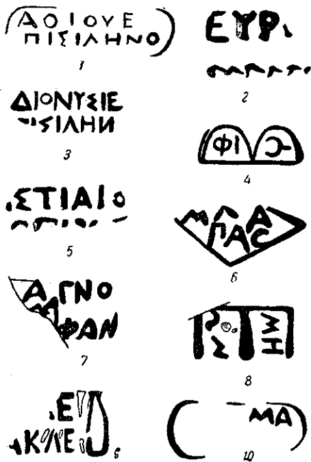
Рис. 1. Давньогрецькі клейма з Лузанівки (1—10).

Клеймо на ручці (інв. № ОГИМ А—64131), дуже потерте, крім емблем видно лише останню літеру етнікона. Згадано А. С. Коцеваловим 18 .