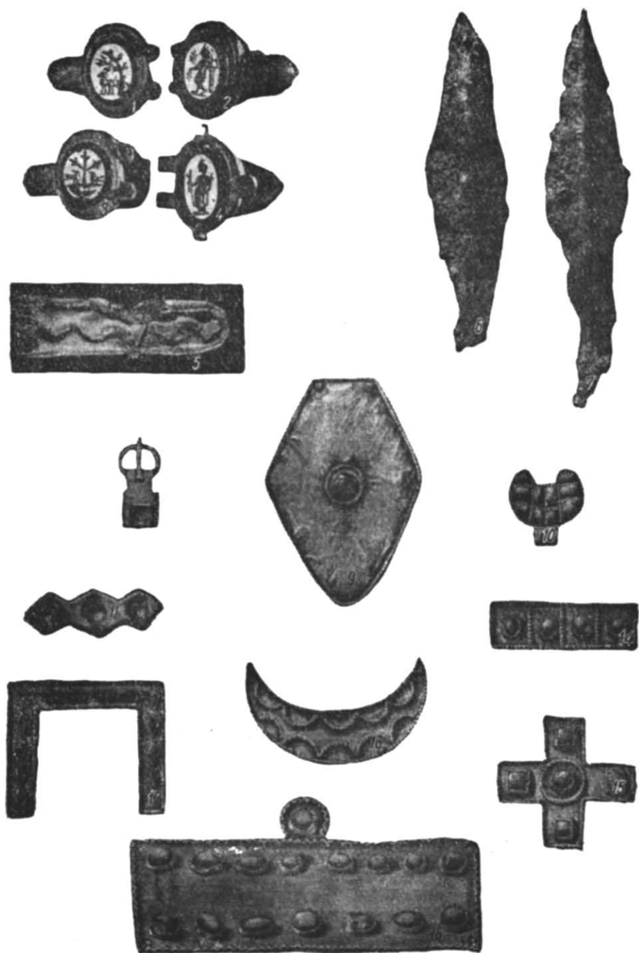
Рис. 2. Речі гунського часу з поховання в с. Новогригорівка і ур. Макартет.