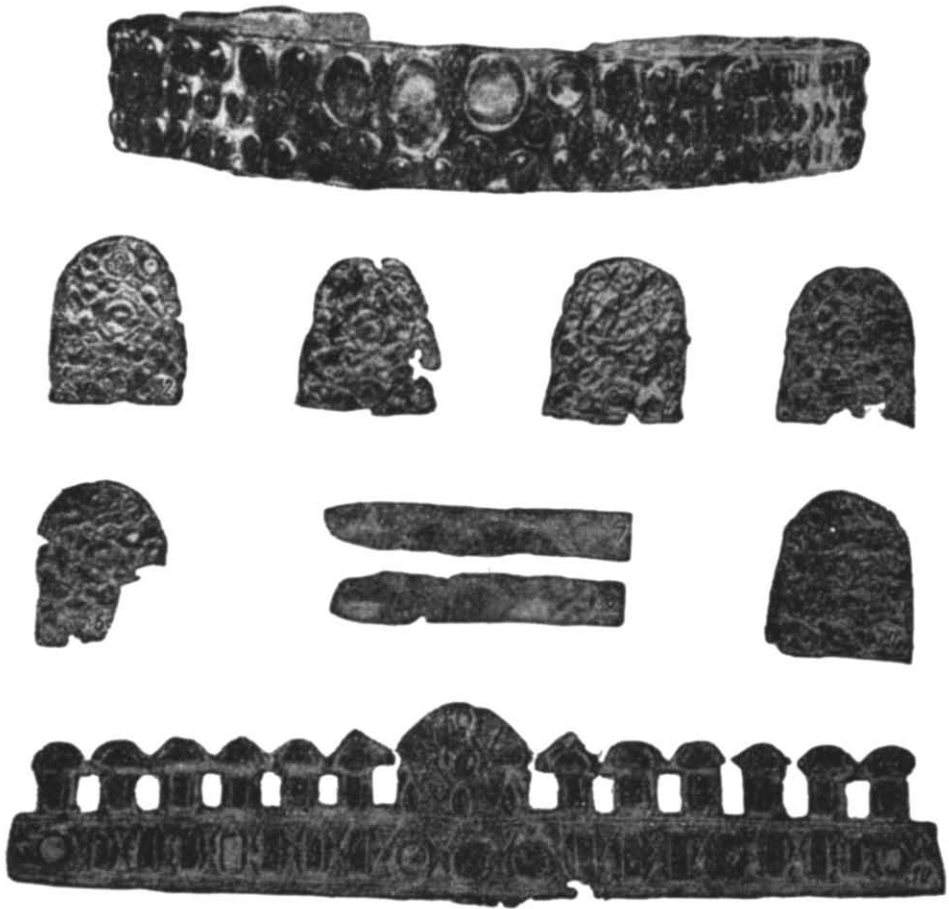
Рис. 1. Речі гунського часу на Україні з Тилігульського лиману та с. Стара Ігрень.

явлене поховання з конем 43 (рис. 1, 2—10), де було знайдено 29 напів-овальних та прямокутних штампованих бляшок, 49 янтарних, дві халцедонові, одна скляна золочена бусина та діадема, інкрустована янтарем в напаяних на ребро перегородках. Склад речей, техніка їх