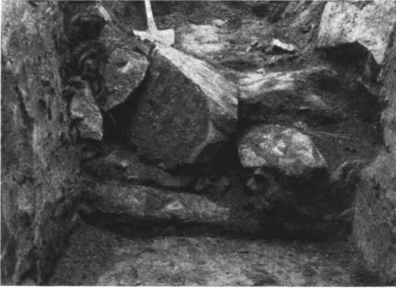
Рис. 4. Бутова кладка східної частини фундаменту брами у теплофікаційній траншеї 1940 р.

Ширина виявленої на тротуарі кладки фундаменту дорівнює 2,3 м. Кладка залягає на глибині 2 м від сучасної поверхні. На відстані 6 м від цієї кладки у траншеї, прокладеній поперек вулиці, зустрілася друга подібна бутова кладка, теж складена з каменів пісковика. Вона почи-