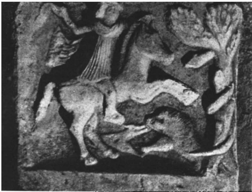
Рис. 1. Перший вапняковий рельєф.