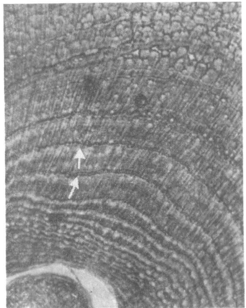
Ростовые слои в верхнем клыке каспийского тюленя (оригинальная модификация импregnации по Бильшовскому-Грос; стрелкой указаны гипокальцинированные слои, \times 40 ).

Недостатком метода является то, что по сравнению с окраской гематоксилином, импregnация-процесс более трудоемкий, требующий соблюдения определенных условий и навыка исполнителя. Это ограничивает область его применения, особенно при массовых определениях возраста. Мы рекомендуем использовать данный метод в качестве контрольного, когда более простые способы дают неудовлетворительные результаты, а также при специальных исследованиях морфологии комплекса ростовых слоев (КРС). В настоящее время КРС исследуются глубоко и всесторонне, выясняются причины и закономерности их формирования. Предпринимаются попытки установить связь между образованием некоторых дополнительных линий и определенными функциональными состояниями животных (Клевезаль, 1982). Это требует детального анализа структуры дентина и цемента, возрастных особенностей процессов обызвествления, учета и классификации дополнительных линий и т. д. На наш взгляд, использование метода импregnации серебром в исследованиях такого рода целесообразно и может принести большую пользу. Импregnация, например, дает возможность дифференцировать