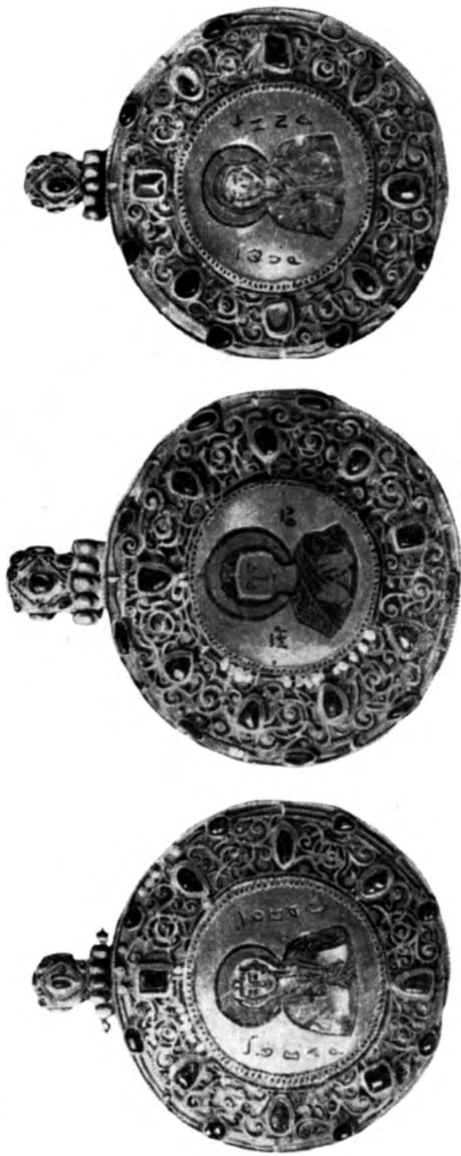
Табл. 1. Барми. Старорязанский скарб 1822 р.