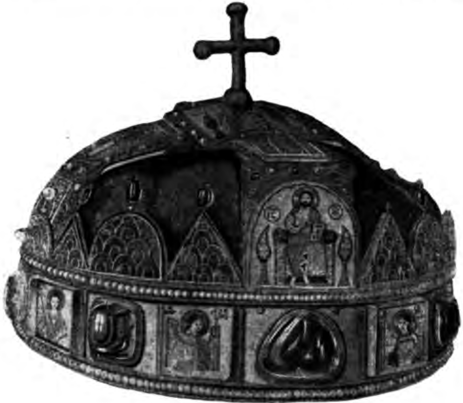
Рис. 4. Угорська корона.

дещо відмінній від діadem композиції. Зміна композиції і заміна деяких членів цього деїсуса були викликані як специфікою призначення шолома, так і специфікою його форми. Згідно з припущенням дослідників шолома, цей деїсус міг означати особисто патрональний характер 36 . Цілком ймовірно, що такий шолом не тільки захищав голову, але також був і знаком князівської відзнаки, а можливо і влади. Іпатівський літопис, описуючи битву при Руті (1151 р.) розповідає, що пораненого Ярослава Мстиславича його ж воїни впізнали лише по зображенню на шоломі: