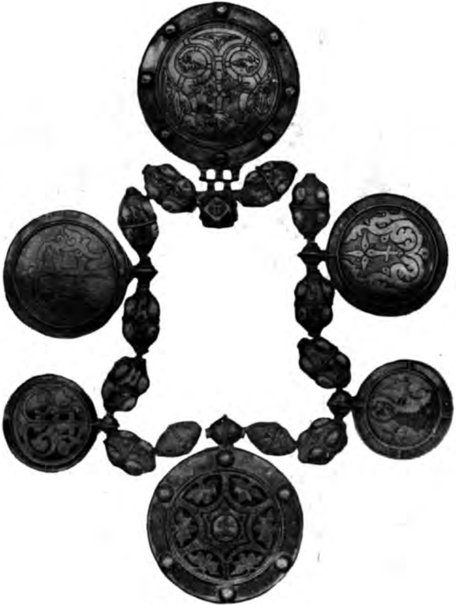
Табл. V. Суздальське оплеччя.

Навряд чи можна сумніватись в тому, що барми, які становлять групу князівських речей, дуже споріднених за своїм змістом з діадемами,