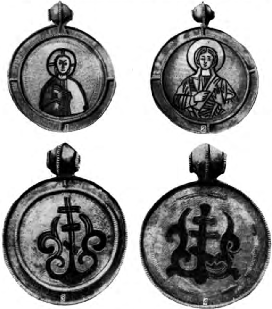
Табл. II. Барми. Старорязанський скарб 1868 р.

VI. У скарбі 1938 р., виявленому по вулиці М. Житомирській, було