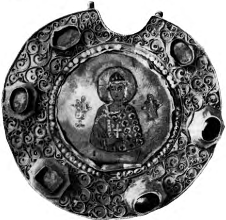
Рис. 5. Медальйон з зображенням Гліба.

Перше визначення речам рязанського скарбу 1822 р. було дане К. Қалайдовичем. Він відніс їх до церемоніальних великокнязівських прикрас і назвав бармами 49 . Всі наступні знахідки такого типу входили в літературу під цією назвою.