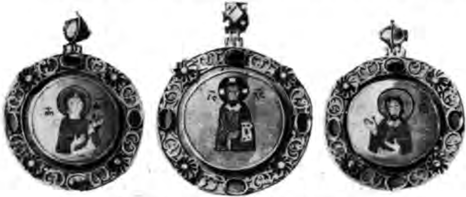
Табл. III. Барми. Київ, вул. Велика Житомирська, скарб 1880 р.

IX. В 1865 р. на тій же території були знайдені фрагменти чотирьох