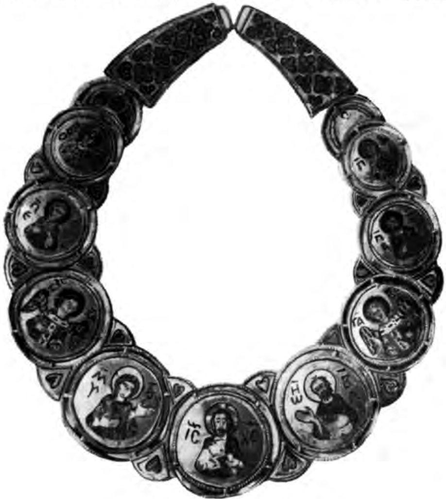
Рис. 6. Золоте оплеччя з Кам'яного Броду.

«Щодо барм,— писав Н. П. Кондаков,— то ми прийшли до остаточного висновку, що слово барма походить від скорочення слова ба гр о-