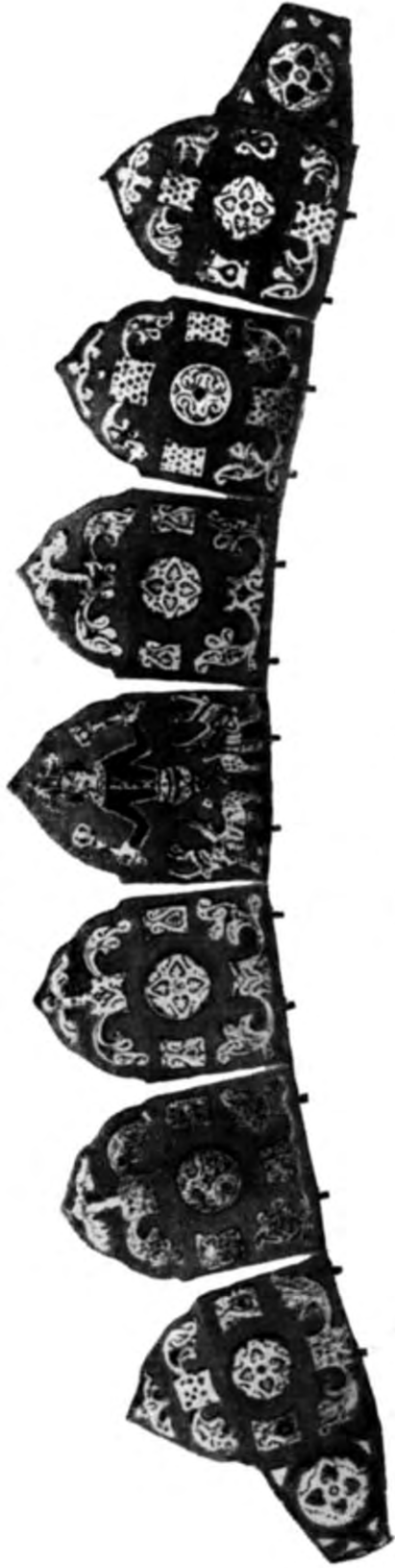
Рис. 2. Сахнівська діадема.