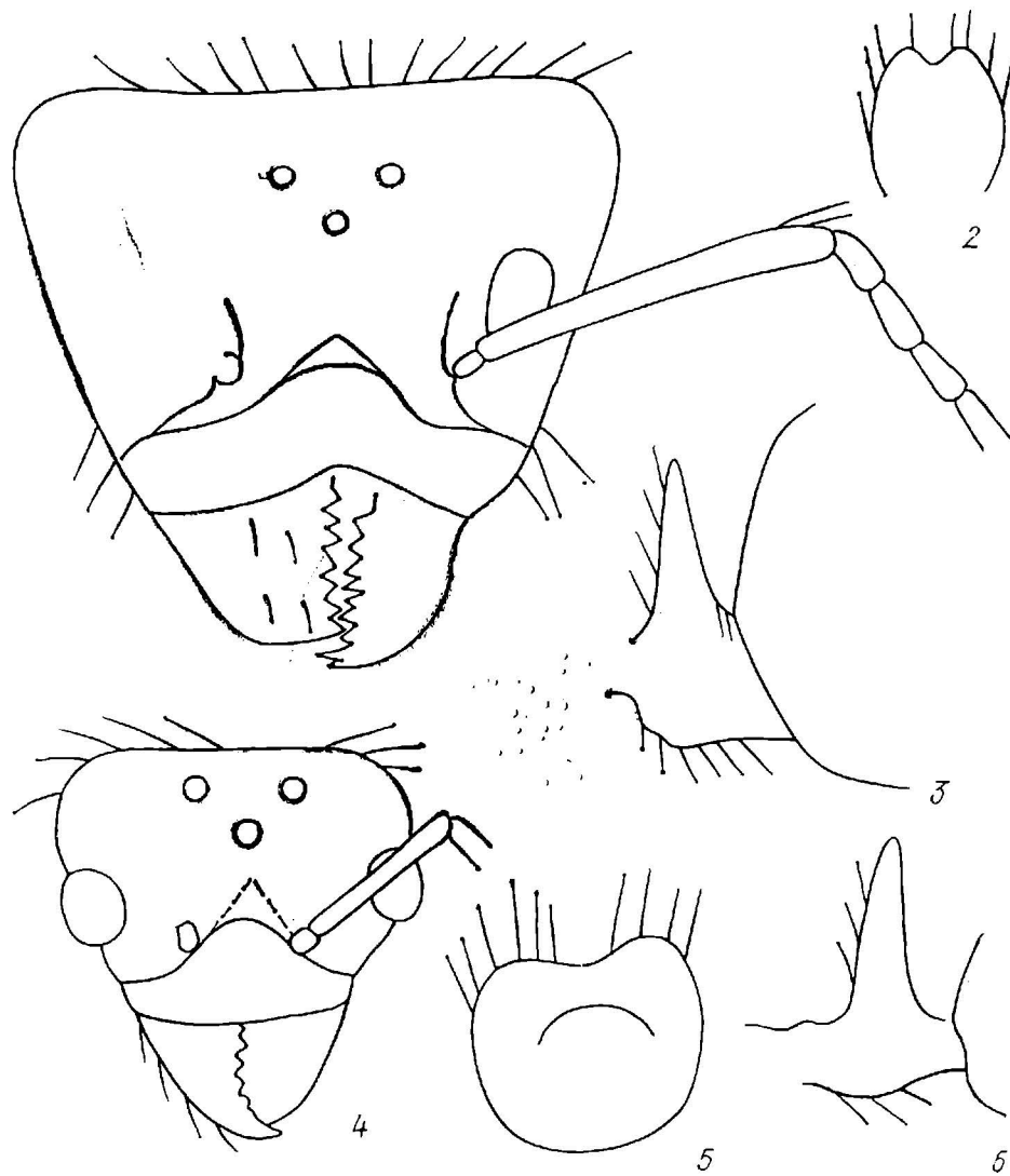
Рис. 2. Детали тела самки и самца L. orientalis :

1—3 — самка; 4—6 — самец; 1, 4 — голова; 2, 5 — чешуйка сзади; 3, 6 — чешуйка сбоку.