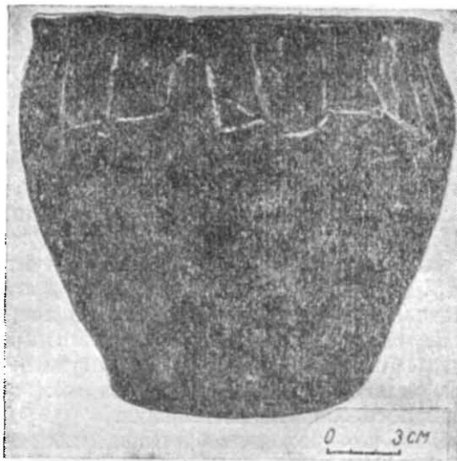
Рис. 1. Стародавня посудина з „письменами“.

Нема сумніву, що поруч з могильником салтівського часу знаходився курган з двома похованнями: основним катакомбним похованням бронзового віку і впускним похованням з посудиною, яка мала „письмена“. Вище від кургана розташовувалися селища бронзового віку і слов'янського часу.