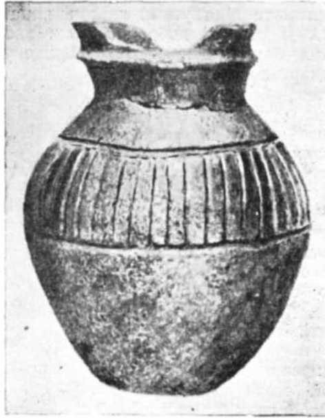
Рис. 4. Глечик хозарського типу.

На території Києва така посудина поки що єдина. Проте виникає припущення, що її можна вважати пам'яткою хозарського перебування у Києві. Адже на Подолі, недалеко від гирла р. Почайни, в урочищі, що названо їх ім'ям, жили хозари. На р. Почайні, як можна зрозуміти із слів літопису 1 , була пристань. Коло неї звичайно мешкала торговельна людність, до якої належали і хозари.