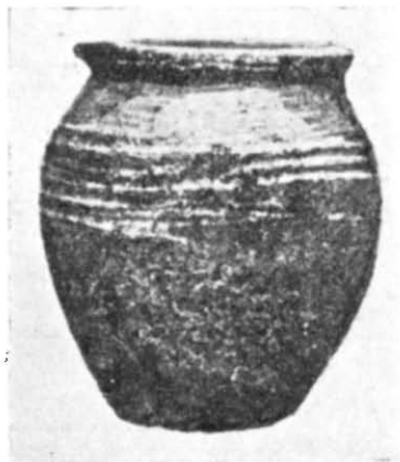
Рис. 3. Глиняний горщик з слов'янського поховання.

Цій цікавій знахідці ми не можемо знайти певної аналогії. Хоча глечик можна порівнювати з деякими посудинами з розкопок у Верхньосалтівському могильнику, наприклад, з глеком (тиквою) з ручкою 1 ,