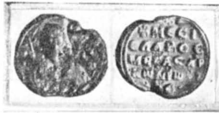
Рис. 1. Висла печатка з Білгородки.

Шість печаток протопроедра Євстафія (цим ім'ям був названий рано померлий син Мстислава Володимировича) знайдені в Новгороді Великому, але оскільки нам нічого невідомо про зв'язки Євстафія Мстиславича з Новгородом, то й приписувати йому цю печатку немає підстав.