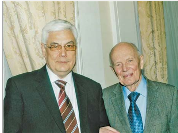
З президентом НАН України академіком Б.Є. Патonom

Властивість започатковувати нове та удосконалювати наявне поєднується ще з однією яскравою рисою Сергія Івановича — здатністю