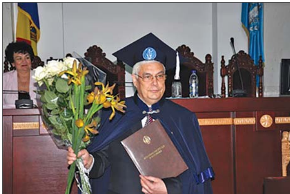
Під час церемонії вручення диплома Doctor Honoris Causa Академії наук Республіки Молдова

могти і підтримати у важкі періоди їхнього життя.