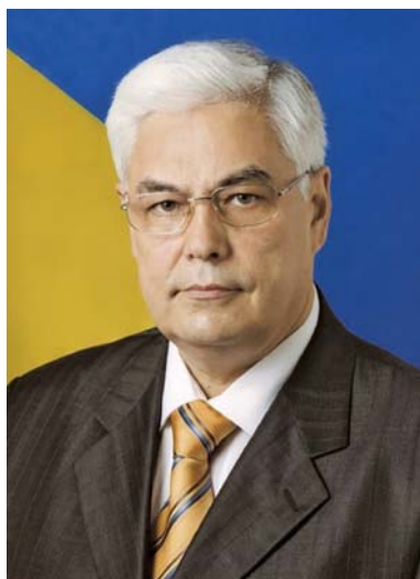
Сергій Іванович Пирожков

Елла Марленівна – академік НАН України, академік-секретар Відділення економіки НАН України, директор Інституту демографії та соціальних досліджень ім. М.В. Птухи НАН України