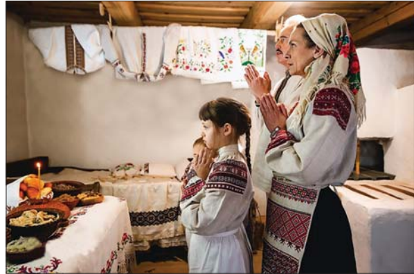
Реконструкція холмського строю.

Нинішня широкомасштабна агресія РФ проти України знову актуалізувала питання