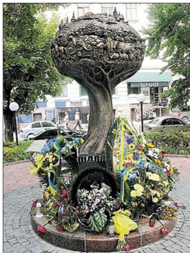
Пам'ятник депортованим українцям у Тернополі (скульптори — Андрій і Володимир Сухорські, Володимир Стасюк)