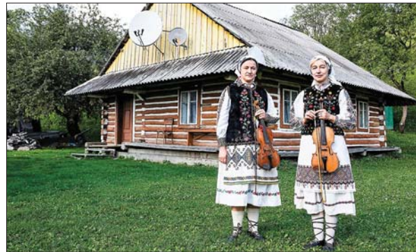
Реконструкція бойківського строю на фоні традиційної хати.