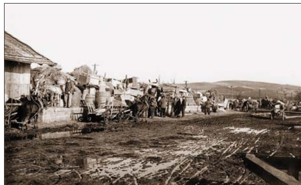
Депортація в УРСР українців з с. Новосільці, Сяноцький повіт, березень 1946 р.

го, образ якого творять як науковці, так і пересічні громадяни з їх колективною пам'яттю та поточними уявленнями про це минуле) [16]. Подібним чином, акцентуючи лише на втратах своєї соціальної групи, переповідають тяжкі спогади про міжнаціональний конфлікт та війну і депортовані поляки [17].