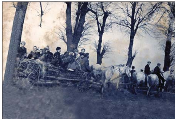
Процес депортації українців з Польщі до УРСР, с. Майдан, Любачівський повіт.