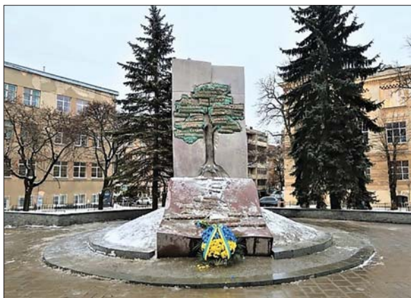
Меморіал українцям, депортованим з території Закерзоння у 1944–1945 рр., у Львові

дали, остальне — пораздали...» [18]. Або ж: «Війна була, біда була. Нас переселили нас ту, ні їсти, ні пити, ні сі ні вбрати» [19].