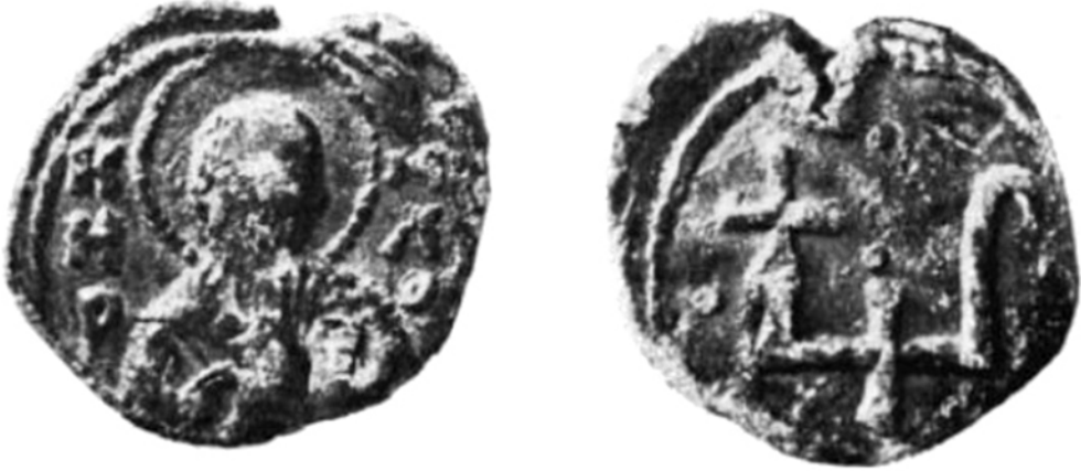
Мал. 1. Печатка з образом св. Кирила та двозубом (за М. Ліхачовим).

Ще одну печатку з образом святого Кирила, але вже з двозубом на звороті (мал. 1), М. Ліхачов аналогічно пов'язував із князем Всеволодом Ольговичем. Стосовно знака на печатці дослідник схилився до думки, що двозуб репрезентує родовий знак князя, але водночас зауважував, що таке визначення лишається гіпотетичним 30 .