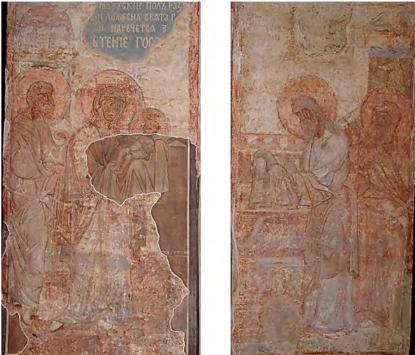
Мал. 3. Композиція «Стрітєння» Кирилівської церкви Києва.

Літописи не називають хрестильного імені Всеволода Ольговича, а в матеріалах синодиків є тільки передсмертне християнське чернече ім'я Кирило, тому для подальшого дослідження пропонуємо залучити нашу гіпотезу щодо тотожності храму літописного монастиря Св. Симеона та споруди Кирилівської церкви Києва 68 . Повертаючись до того, що посвята храму має відповідати імені небесного патрона князя, як і його хрестильному імені, погляньмо на фресковий стінопис його київської церкви, який мусить певною мірою відбивати посвячення центрального вітаря та всієї церкви.