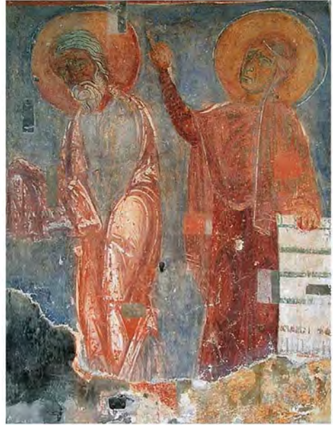
Мал. 4. Композиція «Стрітєння» зі Спасо-Преображенської церкви Польцька (за В. Сарабьяновим).

Для подібної за топографією 71 та сюжетністю фрески «Стрітєння» Спасо-Преображенської церкви Євфросиніївського монастиря (мал. 4), на думку В. Сарабьянова, характерне символічне приєднання до храмового вівтаря, що поєднує позачасовий символізм зображення з конкретністю богослужіння в храмі. Також він зауважував, що тема Спасіння людства є визначальною в іконографії сюжету 72 . Усе це можна сказати й про фреску київської пам'ятки, але з акцентом на персональне довгождане Спасіння 73 святого старця Симеона Богоприємця.