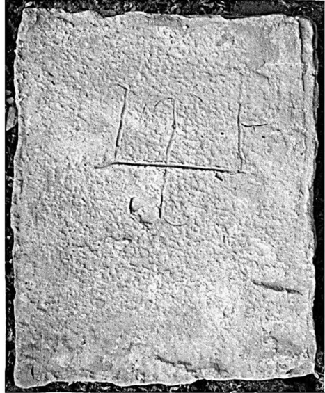
Мал. 2. Замальовка та фотографія плінфи зі знаком у вигляді тризуба.

Вище ми вже згадували примітку Філарета про різночитання в Єлецькому пом'янику «к. Всеволода кївського, во иноцѣхъ Кириллу» 47 та повідомлення М. Грушевського про копію синодика Київського історичного товариства із записом «великаго князя Всеволода кївського, въ иноцѣхъ Кирилла; великаго князя Георгія, убіеннаго в Кіевѣ» 48 . Також можемо долучити опубліковані 2007 р. свідчення з пом'яника Введенської церкви Києво-Печерської лаври, що донедавна майже не використовувалися дослідниками в наукових пошуках, а проте вирізняються повнотою подання інформації 49 .