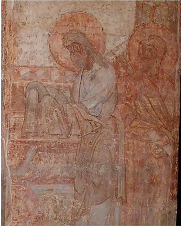
Мал. 5. Образи святого Симеона та Анни Пророкиці з композиції «Стрітєння» Кирилівської церкви.

Попередню думку підкріплює й те спостереження, що образу святого Симеона на південному вітарному стовпі приділено головну увагу, адже його фігура зображена в центрі та займає дві третини площини, а фігура святої Анни міститься буквально на маргінесі сюжету, її німб навіть заходить на червону розгранку (мал. 5). Оскоро зауважимо, що сувій із текстом у її руках згорнутий, тобто перебуває поза увагою у відтвореному символізмi. У згаданій вище композиції «Стрітєння» полоцької Спасо-Преображенської церкви таких деталей іконографії немає (мал. 4): обидві фігури займають однаковий простір, а сувій Анни Пророкиці відкритий для прочитання 74 .