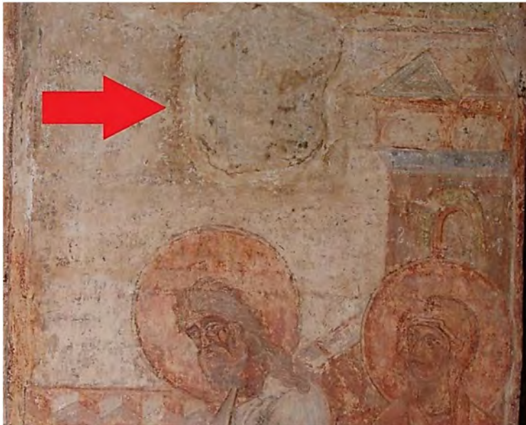
Мал. 6. Підмазка вапняним розчином над образом Симеона.

Вважаємо, що парадно прикрашений рушниковим орнаментальним фресковим розписом простір південної стіни передбачався для підйому князя Всеволода Ольговича на дерев'яний місток-перехід 80 до південного вітарного стовпа – щоб запалити лампаду біля головного образу храму. Показово, що над образом св. Симеона міститься нехарактерна для решти фрескового стінопису пам'ятки пізніша підмазка вапняним розчином (мал. 6), яка може приховувати місце кріплення кронштейна для підвісу-ланцюжка з лампадою.