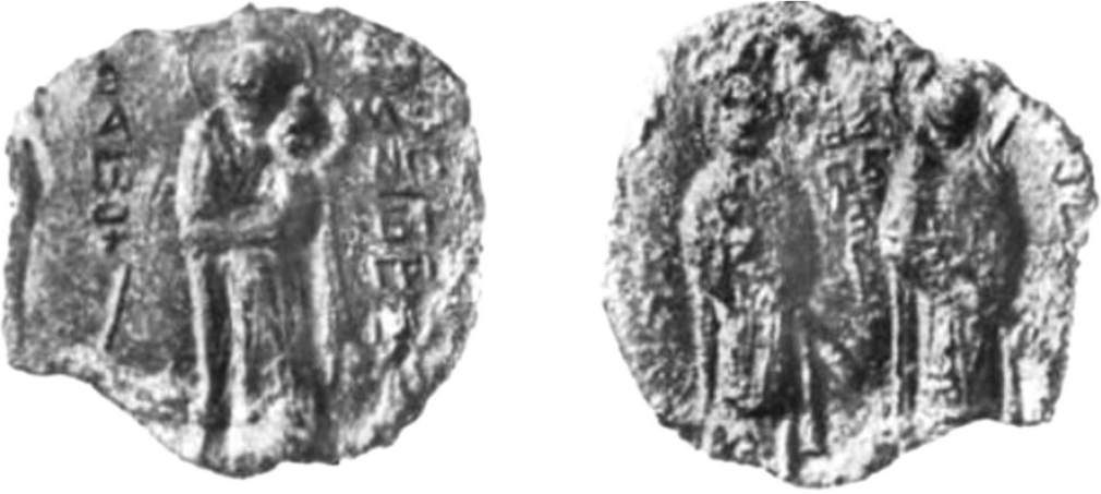
Мал. 7. Печатка з образами св. Симеона Богоприємця та святих мучеників Бориса та Гліба (за М. Ліхачовим).

У цьому контексті особливу увагу привертають спостереження М. Ліхачова щодо можливих шляхів визначення належності печатки з образом св. Симеона Богоприємця на одному боці й святих мучеників Бориса та Гліба на другому (мал. 7). Дослідник ставив запитання, чи не чернігівському князеві Всеволоду Симеону із запису Любецького синодика вона належить? І що означають слова літопису про поховання князя Ігоря Ольговича в київському монастирі Св. Симеона «бѣ бо манастырь ѿца его . и дѣда егъ Стѣслава»? 85