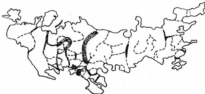
Рис. 2. Суммарные границы перепада частот девяти фенов рисунка в 135 выборках самцов прыткой ящерицы.

Ширина каждой линии пропорциональна числу резких фенетических границ в данной зоне. Видна сложная фенотипическая структура ареала вида.