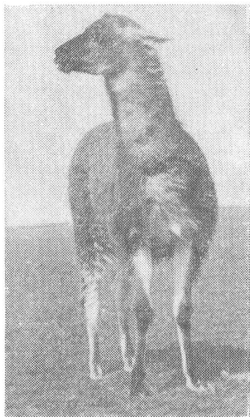
Рис. 3. Гуанако ( Lama guanicoe Muller) в Аскании-Нова.

завезенных в зоопарк до 1933 г. (табл. 1) было получено (с учетом приплода в поколениях) 66 особей (Треус, 1968). Максимальная численность лам была в 1935 г.— 13 особей. С 1935 г. размножение лам прекратилось, а сохранившиеся к началу войны (1941 г.) 9 животных погибли во время бомбежки зоопарка. В 1942—1956 гг. лам в зоопарке не было. После войны глам удалось завезти только в 1958 г. (1 самца и 2 самки — Ласточка, Лайка), причем самец погиб через год, не оставив потомства. Не оставили потомства и самцы глам, завезенные в зоопарк в 1960 г. и 1964 гг., в связи с чем самок Ласточку и Лайку покрывали самцы гуанако. Гуанако же впервые были завезены в СССР в Асканийский зоопарк в 1957 г., а в 1959 г. от них получен первый приплод. В 1959—1972 гг. всего было получено (с учетом приплода в поколениях) 17 чистокровных гуанако и 27 их помесей с гламой, в т. ч. 1 мертворожденный и 8 слабых гламчат, которые, прожив от 2 до 19 дней, погибли. Итак, в Аскании-Нова в 1902—1972 гг. получено в приплоде 110 глам, гуанако и их помесей (53 самца и 57 самок), 30 из которых были переданы в другие зоопарки нашей страны.