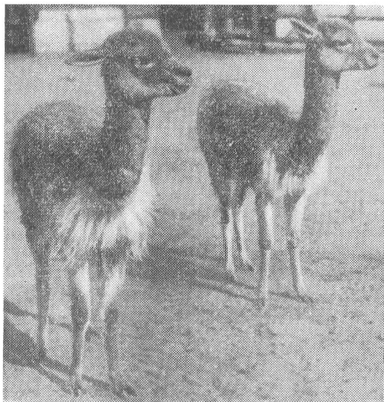
Рис. 2. Викоунья ( Lama vicugna Molina) в зоопарке Франкфурт-на-Майне.

Первая пара лам была завезена в зоопарк «Аскания-Нова» в 1900 г., а в 1902 г. эти животные дали первое потомство (рис. 4). От 7 глам,