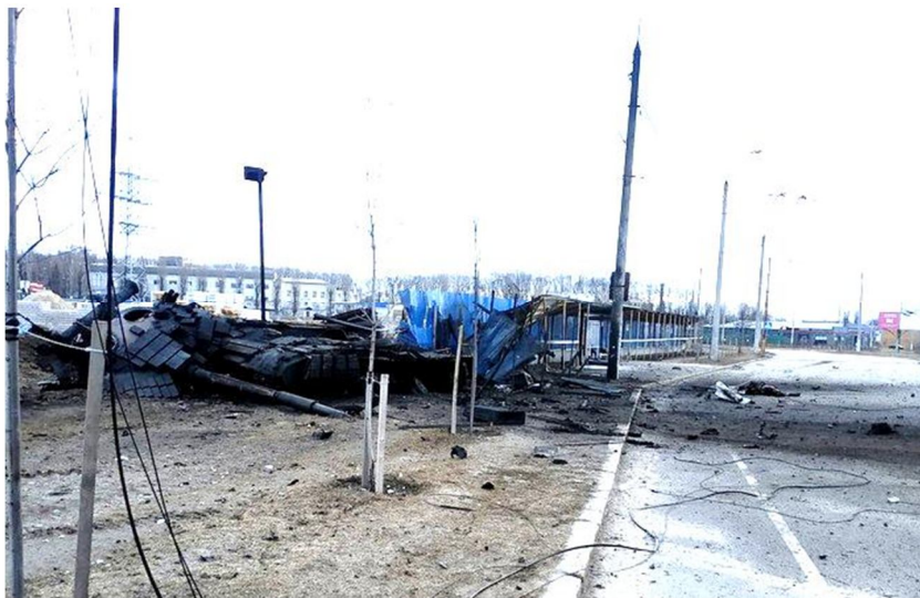
На фото – згорілий танк у лютому 2022-го, де перебував екіпаж Івана Ковалья. На цей час танк вже прибрали