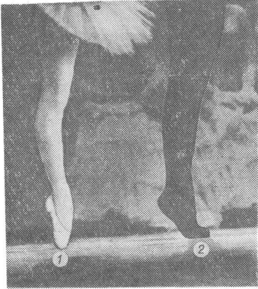
Рис. 1. Опора балерин и артистов балета: 1 — на концевые фаланги; 2 — на пальцы.

4 мес.) и в последнюю очередь дистальный эпифиз МТ5 (14 лет 6 мес.). Процесс окостенения эпифизарных хрящей элементов стопы заканчивается в среднем к 14 годам 6 месяцам. У юношей, как и у девушек, в первую очередь окостеневают tuberositas МТ5 (13 лет 8 мес.), затем — проксимальный эпифиз рhIII первого пальца (15 лет 8 мес.), задняя бугристость calcanei (16 лет 2 мес.), проксимальный эпифиз рhI третьего пальца (16 лет 6 мес.), проксимальный эпифиз рhI второго и четвертого