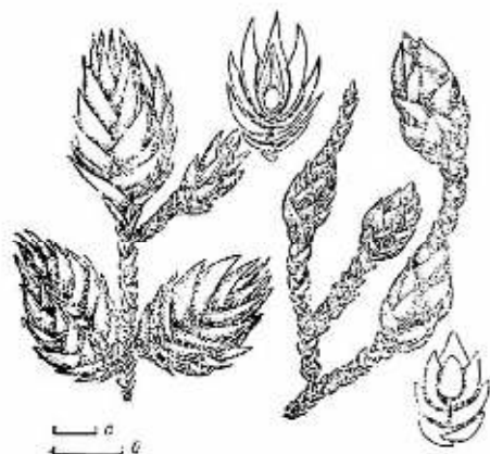
Рис. 3. Галлы: а — Etsuhoa kugitangica sp. n.; б — E. kopetdagica sp. n. (масштаб — 2 мм).

Биология. Личинки розовато-оранжевые, развиваются по одной в единственной центральной камере галла, который напоминает шишечку на вершине побега или