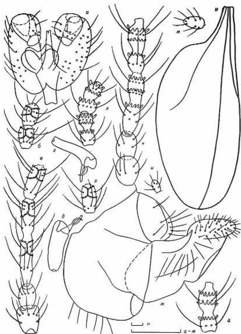
Рис. 1. Детали строения Etsuhoa kugitangica sp. n.: а-гениталии; б-11-й и 12-й членики жгутика самки; в—скапус, педицелл, 1-3-й членики жгутика самки; г—коготок лапки самца; д—коготок лапки самки; е—5-й членик жгутика самки; ж—яйцеклад; з—5-й членик жгутика самки; и—щупик самца; к—скапус, педицелл, 1-й и 2-й членики жгутика самки; л—11-й и 12-й членики жгутика самки; м—щупик самки; н—крыло самца (масштаб—0,1 мм).

ми широкой треугольной вырезкой. Гипопрокт в 1,3 раза уже них, с овальной вырезкой. Эдеагус плавно сужается к вершине, двулопастной на конце.