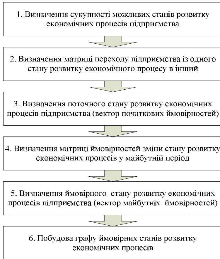
Рис. 1. Послідовність реалізації визначення ймовірного стану розвитку економічних процесів із використанням ланцюгів Маркова

Ланцюг Маркова є однорідним, якщо ймовірність p_{ij}^{(n)} від n не залежить, у цьому випадку вони позначаються без верхнього індексу: p_{ij} . Числа p_{ij} називаються ймовірностями переходів, а