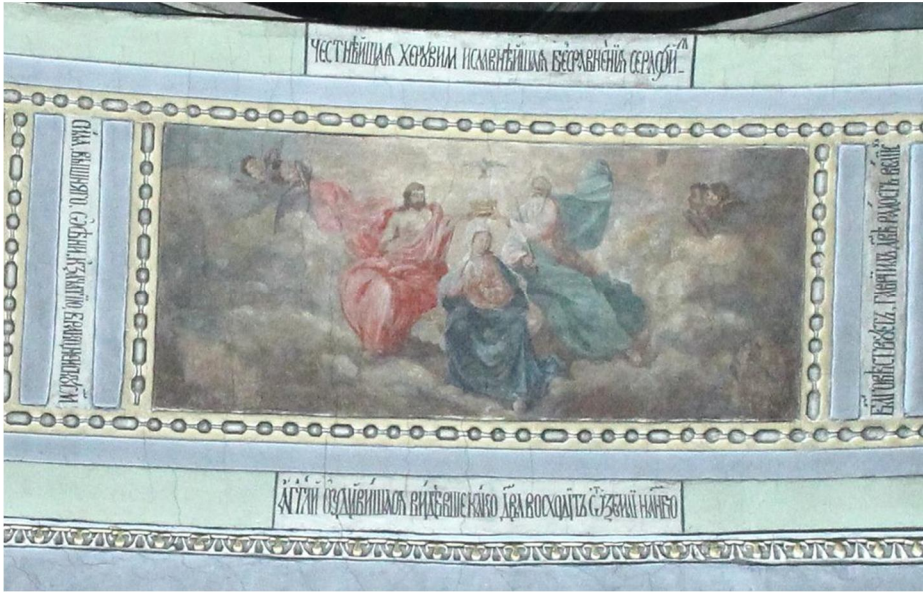
Іл. 5. Центральна композиція південної арки, композиція «Коронування Богородиці». Сучасний стан.

Внизу під композицією бачимо напис: «Ангели, Успіння Пречистої бачучи, здивувалися, як то Діва сходить від землі на небо». Це рядок із задостойника свята Успіння Пресвятої Богородиці, підпис до сюжету, розміщеного по центру склепіння трансепту.