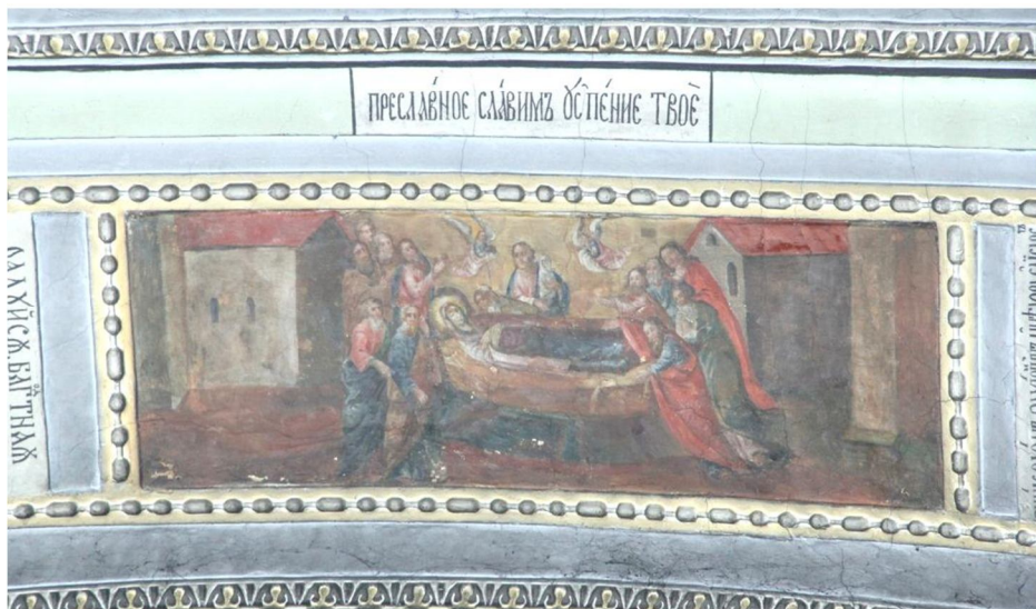
Іл. 4. Центральна композиція північної арки північного трансепту, сюжет «Успіння Богоматері». Сучасний вигляд.

Стилістично надзвичайно відрізняється від описаних композицій зображення у центральній прямокутній рамі північної арки трансепту. Змальований тут сюжет «Успіння Богоматері» має на відміну від решти композицій на арках горизонтальну орієнтацію, на ньому превалує тепла кольорова гама (Іл. 4). Для зображення характерне тяжіння до площинності та силуетності, зведення фігур до свого роду орнаментальних знаків без промальовки деталей та індивідуальних рис, а іконографії сюжету – до найпростішої схеми, де сприймається сама її суть.