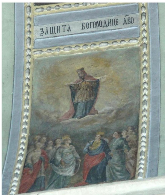
Лл. 3. Західний схил південної арки, композиція «Захисти Богородице Діво». Сучасний вигляд.

Традиційним для українського іконопису XVIII–XIX ст. зображенням сюжету «Покрови Богородиці» є крайня із заходу композиція південної арки, над прямокутною рамою якої церковнослов’янською мовою зроблено напис «Захисти Богородице Діво». У верхній частині композиції бачимо Богоматір, що стоїть на хмарах, оточену золотаво-жовтим світінням, з розведеними в сторону руками. Одягнена у синій хітон, жовту, прикрашену візерунками, туніку довжиною до колін, червоною мафорією, що вкриває плечі та голову, поверх нього – пишній вінець. З-під мафорію видно краї рукавів хітону, оздоблених поручами. Голова Марії схилена трохи праворуч і погляд очей спрямований униз. Таким чином вся постать ніби звернена до землі, до людей, зображених у нижній частині композиції (Лл. 3).