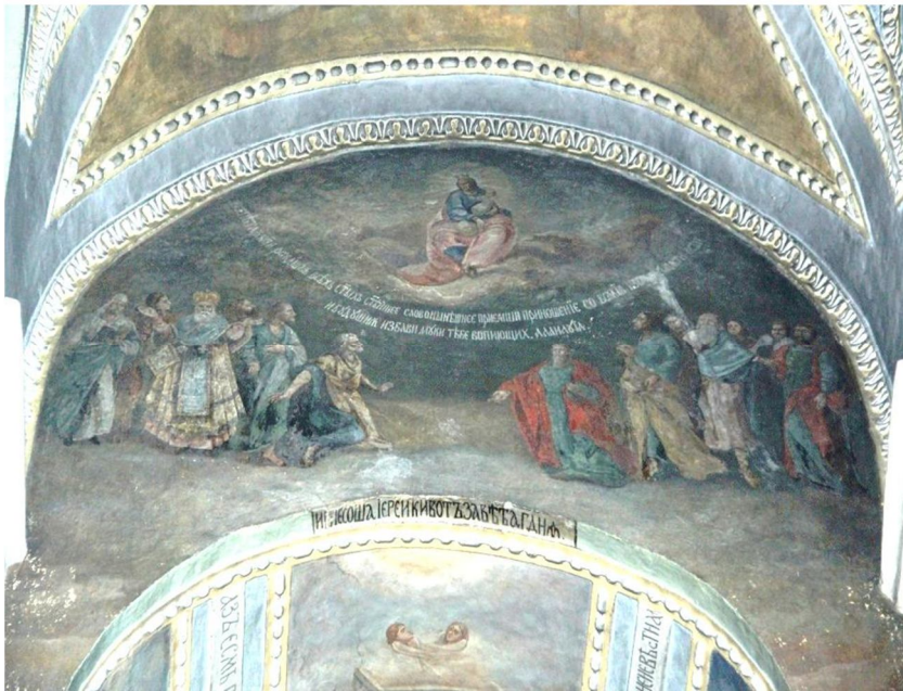
Іл. 2. Західна стіна північного трансепту, композиція «О, Всехвальна Мати». Сучасний вигляд.

На західній стіні північного трансепту, над аркою хорів собору художниками XIX ст. створено цікаву багатофігурну композицію «О, Всехвальна Мати» (Іл. 2).