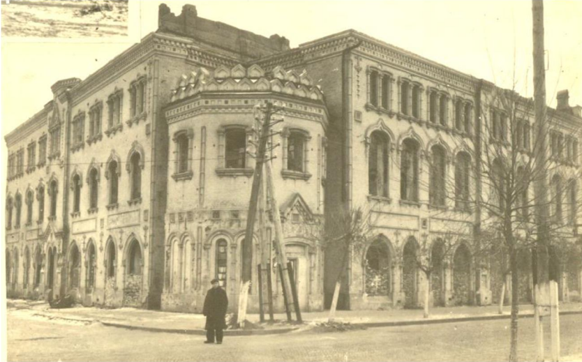
Фото 4. Світлина часів німецької окупації 12 .

У серпні 1941 р. під час німецько-фашистських бомбардувань приміщення театру було пошкоджено (Фото 4).