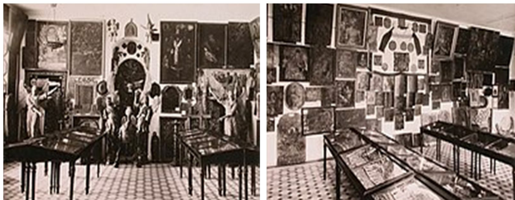
Фото 2. Церковне давньосховище в приміщенні Чернігівського Миколаївського єпархіального будинку 8 .

1923 р. п'ять чернігівських музеїв об'єдналися в Чернігівський державний музей, якому в 1925 р. виділили будинок колишнього Селянського банку (суч. Бібліотека ім. В.Г. Короленка). 1933 р. музей переїхав на Вал – у будинок класичної чоловічої гімназії.