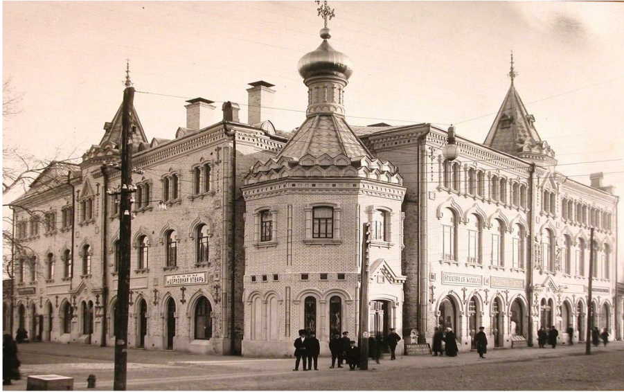
Фото 1. Дім Миколаївського єпархіального братства. Чернігів, 1912 р.

ське Єпархіальне братство св. Михаїла”, у якому розміщено 14 зовнішніх та інтер’єрних видів цього будинку» 2 . Цей фотознімок представлений на поштівці* 1910-х рр. з коментарем «Домъ Єпархіального Братства. Черниговъ» 3 .