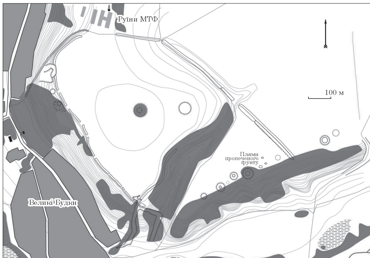
Рис. 2. План укріплення біля с. Великі Будки (за Гречко, Осадчий, Крютченко 2020), доповнений

С. А. Мазаракі (Самоквасов 1908, с. 110—111; Ильинская 1968, с. 41—43). Точну кількість досліджених насипів встановити не вдається, адже інформація в різних джерелах різниться. Зокрема, В. А. Іллінська наводить дані про три кургани (Ильинская 1968, с. 41), тоді як Д. Я. Самоквасов вказував, що тільки він розкопав шість курганів в урочищах «Попова лужа» та «Провалля» поблизу с. Великі Будки (Самоквасов 1908, с. 110—111). Дані про кількість розкопаних курганів С. А. Мазаракі майже відсутні, фактична інформація лише побіжно згадана у того ж таки Д. Я. Самоквасова, який вказував про декілька розкопаних могил, які розташовувались на підвищенні біля урочища Провалля (Самоквасов 1908, с. 110—111). На сьогоднішній день візуально простежується п'ять розкопаних насипів. Цікаво що серед перших даних про могильник біля с. Великі Будки ми зовсім не знаходимо інформації про наявність валу та рову. Цей факт є дивним, адже в деяких місцях вони збереглися досить добре.