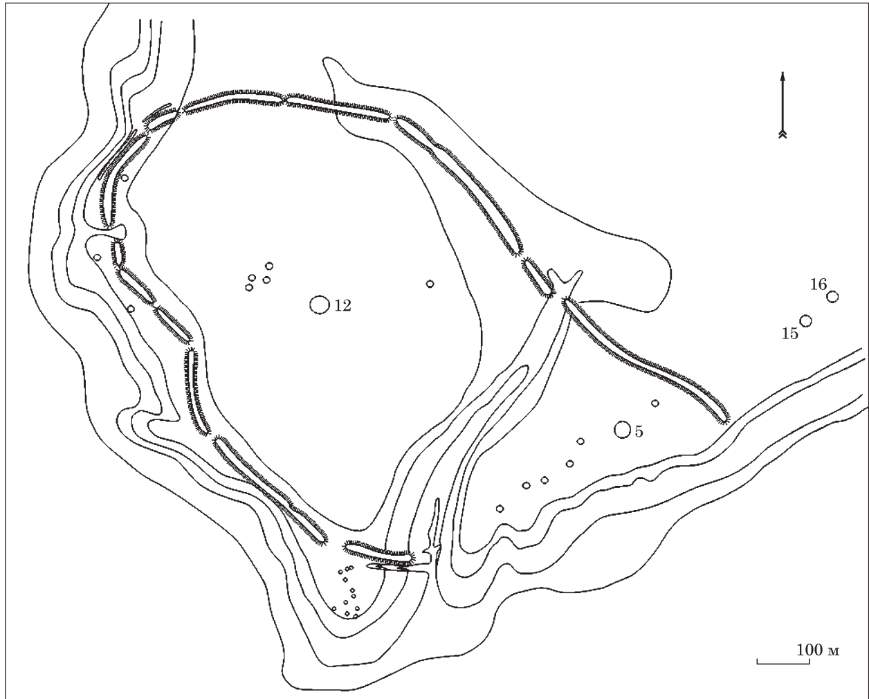
Рис. 3. План укріплення біля с. Великі Будки (за Семенчик 1927), з позначенням номерів окремих курганів

ніж інші пам'ятки регіону і причиною цього є неясність призначення валу, яка залишилась після розвідок В. А. Іллінської в 1946 р. Під час обстеження було зібрано нечисельний підйомний матеріал, за яким укріплення віднесено до скіфського часу. Для підтвердження культурної приналежності даного об'єкту було закладено три шурфи — один з яких в північно-східній частині, а два інших ближче до центру. На півдні в місці де вал було поруйновано балкою, проведено зачистку профілю укріплень. У шурфах 2 і 3 було виявлено слабо виражений культурний шар, потужність якого доходить до 0,5 м. У шурфі 3 було знайдено вінце ліпної миски. За зібраним матеріалом Б. А. Шрамко, відносив укріплення біля с. Великі Будки до городищ скіфського часу, а за знайденим вінцем миски не виключав його існування у ранньоскіфський час (Шрамко 1970, с. 39—41).