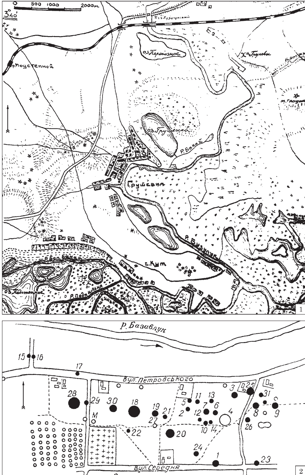
Рис. 1. Зона досліджень експедицій Д. Т. Березовця у 1951 і 1953 рр.: 1 — загальний план робіт Горностаївської експедиції; 2 — план курганної групи у с. Кут (за Березовець 1951)

жується до кільцевого конічного піддону. По основі вінець — подвійна врізна лінія. На плічку дві (збереглася одна) сплюснуті на згині ручки з