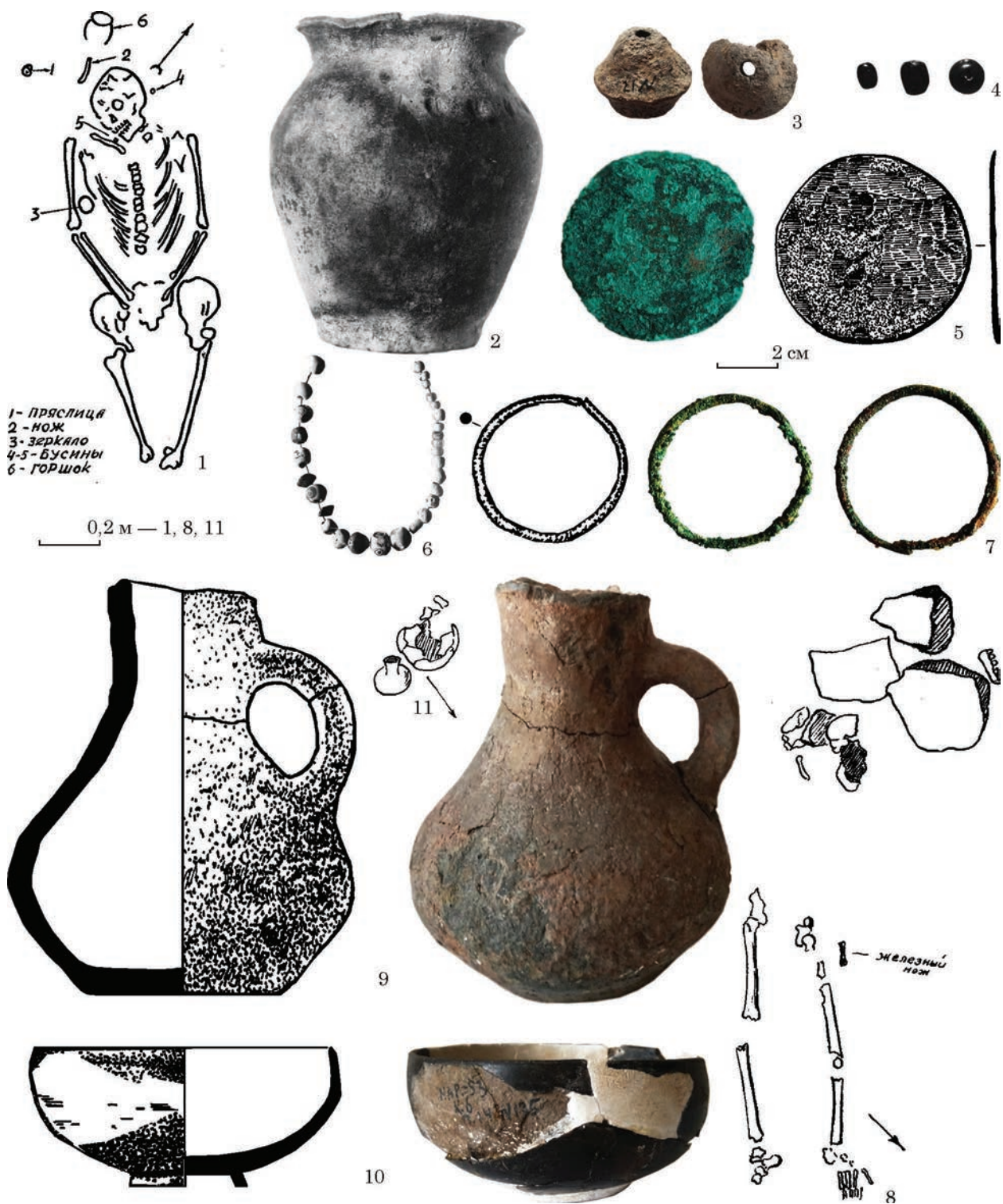
Рис. 6. Сарматські поховання біля с. Мар'янське: 1—7 — курган 3, пох. 6; 8 — курган 5, пох. 6; 9—11 — курган 6, пох. 14 (фото автора; 1—3, 5, 6, 9 — за Фурманская и др. 1953)

руди не простежувалися. На глибині 0,65 м — череп скелета, орієнтований на північ — північний схід (рис. 6: 9). Поруч знайдено посудини (1, 2).