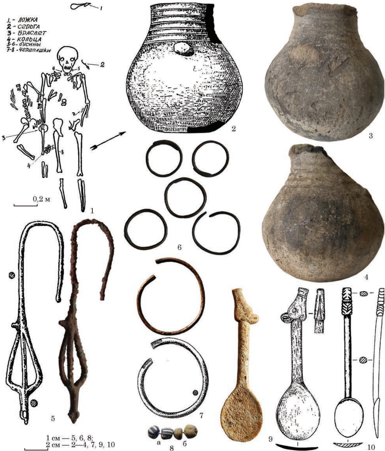
Рис. 4. Грушівка, к. 5, п. 1: 1 — план; 2—4 — горщик; 5 — підвіска; 6 — обручки; 7 — браслет; 8 — намисто; 9 — ложечка; 10 — ложечка, Перегрузне 1, к. 45 (за: 1 — Березовец 1952; 2, 5, 7, 9 — Смирнов 1984; 10 — Балабанова та ін. 2014)

описаний ним поховальний обряд є незвичний для сарматів, перш за все, відсутністю могильної ями. Вивчення польової документації (щоденника і креслень) не прояснило питання. Згідно тексту Д. Т. Березовця, скелети лежали на материку, але рівень залягання материка не позначений. При висоті насипу у 0,5 м (від сучасної поверхні?) та звичайній потужності орного шару в цих краях біля 0,3—0,4 м рівень