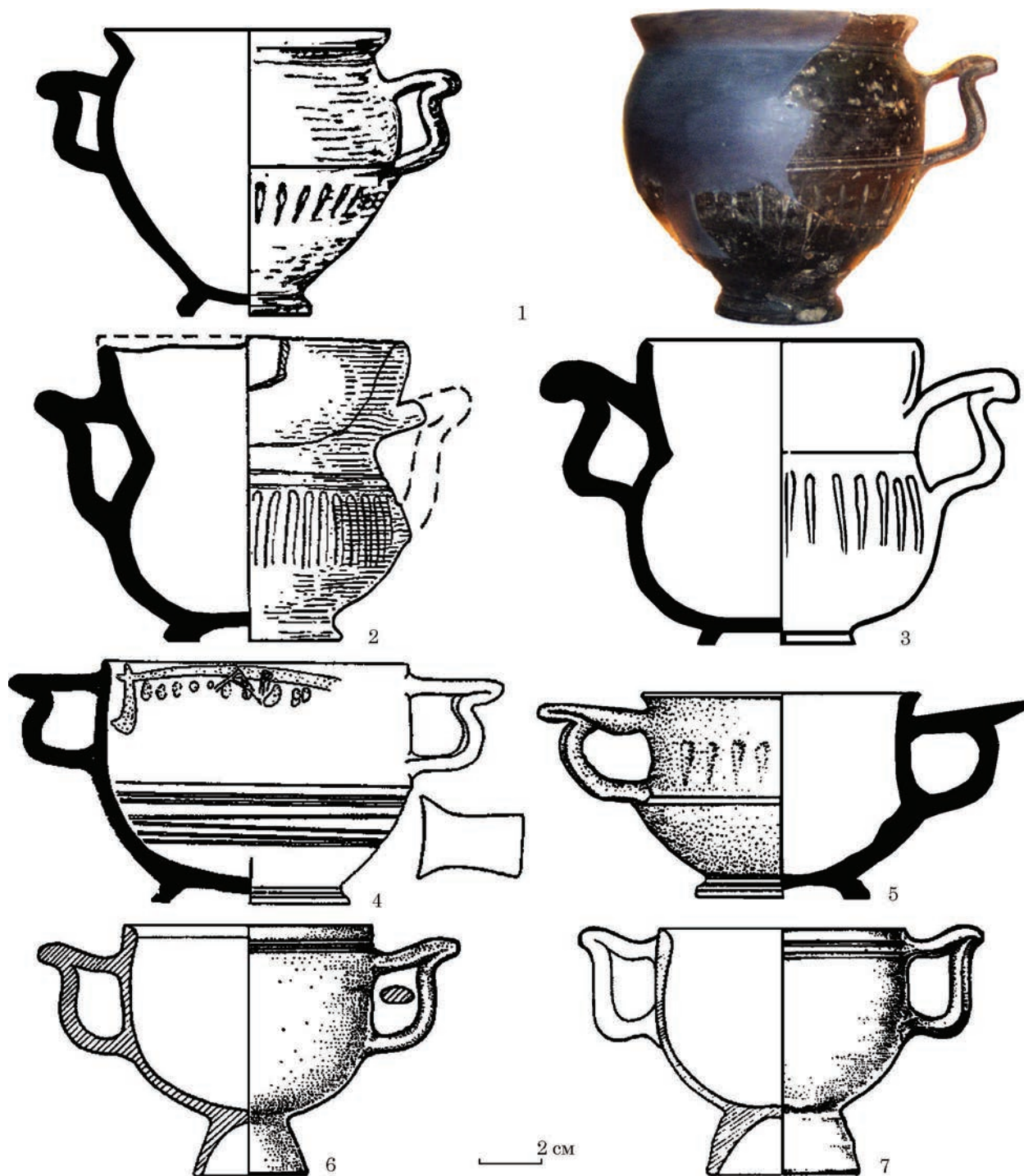
Рис. 3. Канфари пізньоелліністичного типу: 1 — Кут, к. 1, насип; 2 — Золота Балка, пох. 43; 3 — могильник Криволіманський 1; 4 — могильник Біляус, пох. 39; 5 — могильник біля хут. Леніна, пох. 3; 6, 7 — резиденція Хрисаліска (за: 1 — фото автора; 2 — Вязьмитина 1972; 3 — Глухов 2005; 4 — Дашевская 2014; 5 — Лимберис, Марченко 2005; 6, 7 — Сокольский 1976)

виготовлення обидва глеки є типовими зразками пізньоелліністичної кераміки. Цікаво, що у деяких ранньосарматських похованнях півдня України (Львове, к. 6, п. 1; Заможне, к. 13, п. 1) виявлені ліпні сарматські репліки античних глеків з наліпним ребром по горлу (Симоненко 1977, с. 226—227, рис. 4: 2; 1991, с. 26, рис. 3: 3). Чорний матовий лак дозволяє віднести кутянський глек до пізньоелліністичного часу.