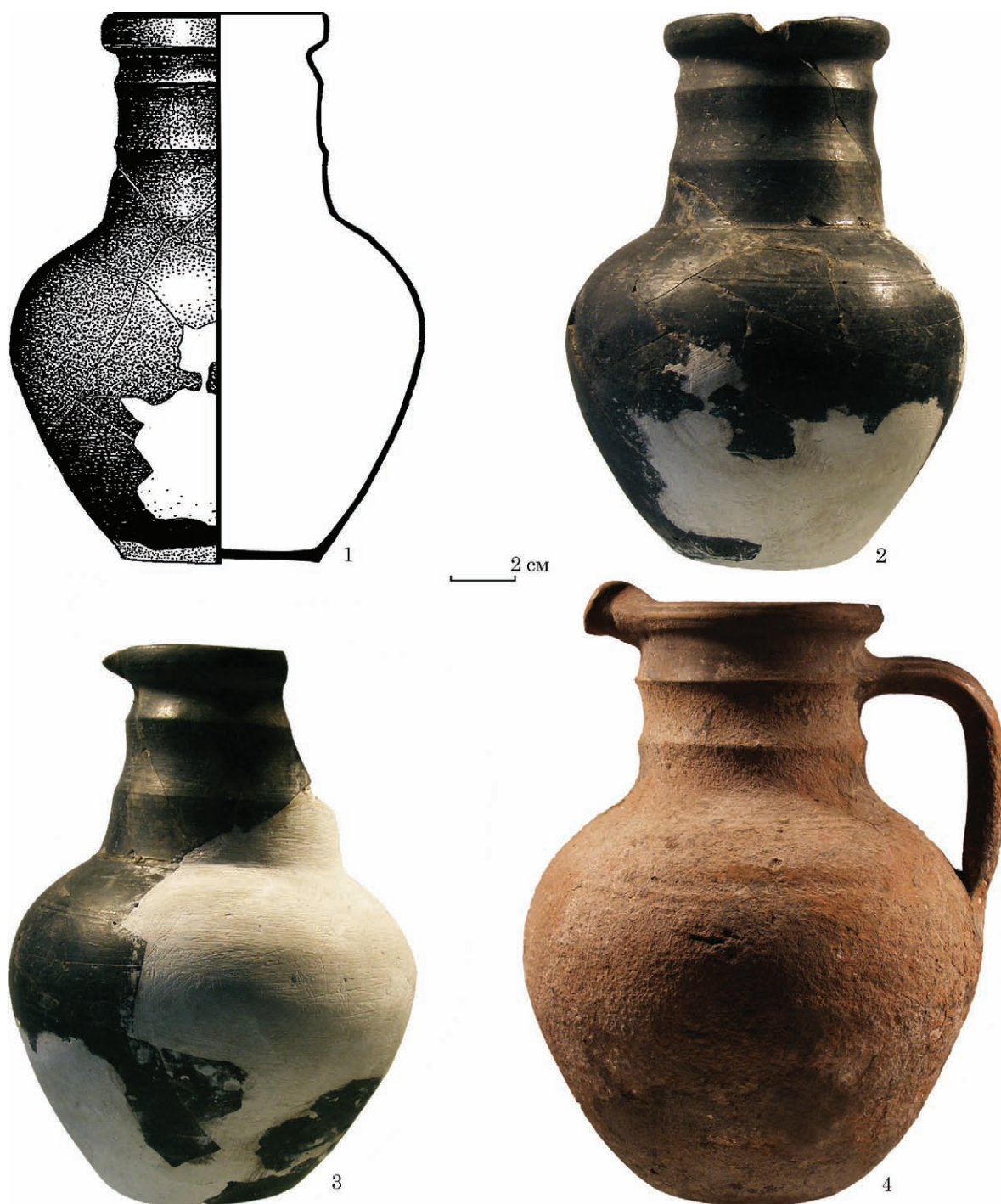
Рис. 2. Керамічний посуд: 1—3 — Кут, к. 1, насип; 4 — Новогригорівка, к. 1, п. 22 (фото автора)

ки, що імітують канелюри (рис. 3: 1). Поверхня вкрита чорним матовим лаком. Діаметр вінець 9,2 см, піддону 4,2 см, висота посудини 9,7 см.