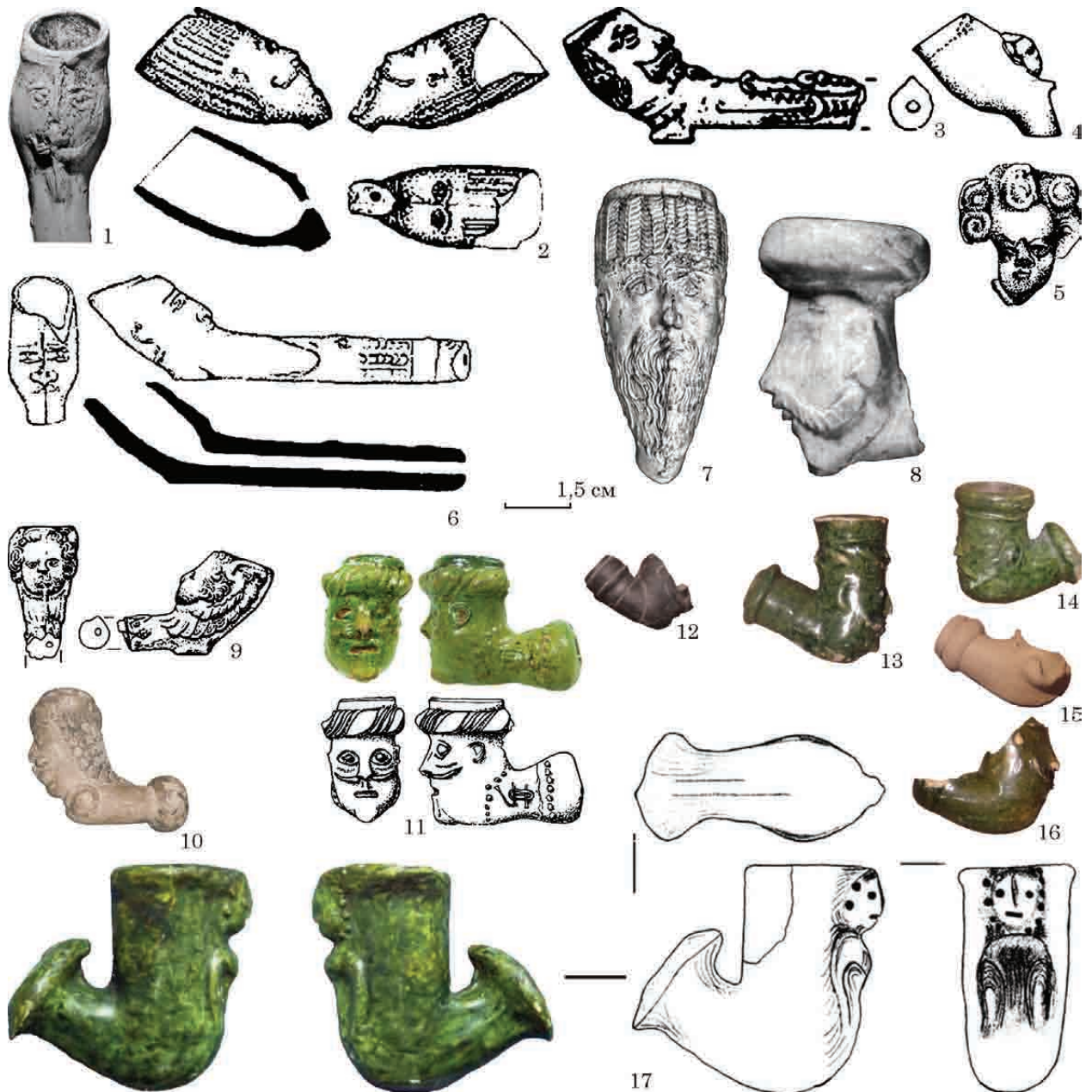
Рис. 1. Керамічні люльки із зображенням голови людини або обличчя: 1 — люлька північно-західного типу з обличчям чоловіка. XVII ст. (Holčík 1984, s. 90, далі посилання на джерело див. у тексті); 2 — Гданськ, XVII ст.; 3 — сюжет «крокодил ковтає чоловіка», Регенесбург, Баварія, Німеччина, 1640—1670 рр.; 4, 5 — зображення путті, Прага, друга половина XVII ст.; 6 — Гданськ, 30-ті рр. XVII ст.; 7 — Зборовське, Верхня Сілезія, друга половина XVIII ст.; 8 — Варшава, друга половина XVII ст.; 9 — люлька північно-західного типу із зображенням путті, Амберг, Баварія, Німеччина, середина XVII ст.; 10 — Перемишль, Музей Перемиської землі; 11 — Брно, остання третина XVII ст.; 12—17 — Краків, археологічний музей

теж були майстерні з виробництва люльок (наприклад, з 1628 р. у Кельні). Прикладом можуть бути люльки, знайдені в Гданську, де найстарші знахідки датовані 30-ми роками XVII ст. (рис. 1: 2, 6; Daňal 2013, s. 203, 215—216). Популярним сюжетом було зображення голови чоловіка з бородою і вусами, якого ковтає крокодил, ілюстрація анекдоту про Волтера Релі (Walter Raleigh) — англійського державного діяча, мореплавця і поета. Рельєфне зображення тварини знаходилося на мундштуку (рис. 1: 3, 6; Daňal 2013,