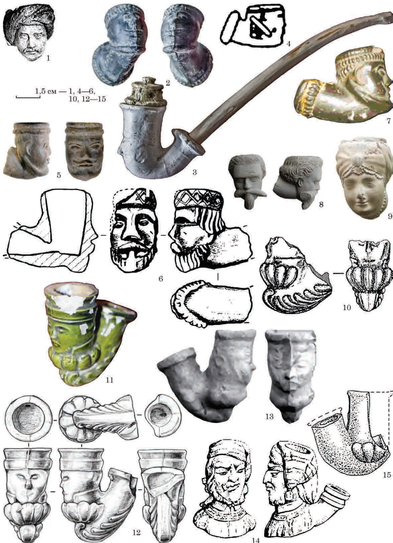
Рис. 3. Керамічні люльки XVIII—XIX ст. із зображенням голови людини або обличчя: 1 — Київ, вул. Олександрівська, 41; 2, 3 — музей Державного історико-культурного заповідника, Острог; 4 — Москва, XVIII ст.; 5 — Маріуполь, середина XVIII ст.; 6 — Миропілля, Сумська обл.; 7 — Дединово, Московська обл., початок XVIII ст. 8 — люлька з клеймом «...HONIG W... / ... SNEHMNITZ», знайдено в Дубровнику, Кула Горні, Хорватія, вироблена у Банській Штявниці, Словаччина, початок XIX ст.; 9 — р-н Кам'янської січі, Херсонський обласний краєзнавчий музей, XVIII ст. 10 — Київ, ур. Гончарі-Кожум'яки, XVIII ст. 11 — музей Державного історико-культурного заповідника, Дубно, XVIII ст.; 12 — Хмільник, XVIII—XIX ст.; 13 — Острог, XVIII—XIX ст. 14 — «моряк з люлькою», вироблено Blanc Garin у м. Живе (Givet), знайдено на о-ві Помег, Фріульські о-ви, Марсель, Франція; 15 — Київ, ур. Гончарі-Кожум'яки, вул. Воздвиженська, 50, XVIII ст.