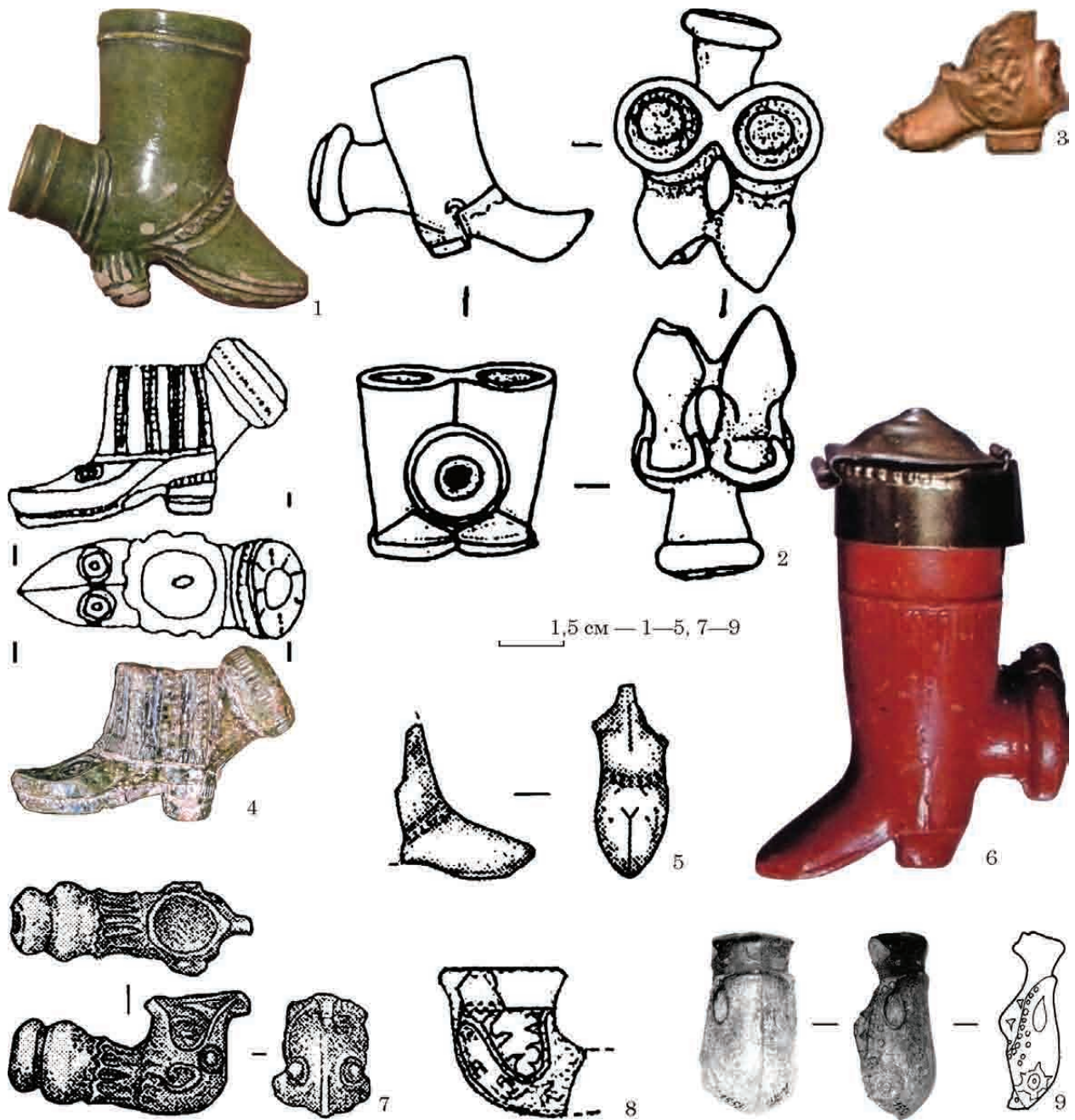
Рис. 5. Керамічні люльки із зображенням чобіт і люльки із зооморфними елементами: 1 — археологічний музей в Кракові; 2 — Київ, ур. Гончарі-Кожум'яки, вул. Воздвиженська, 43, друга половина XVIII ст.; 3 — Прага, р-н Na Poříčí, XVIII ст.; 4 — Батурин, цитадель, початок XVIII ст.; 5 — Київ, Печерськ, вул. Цитадельна, 3, початок XVIII ст.; 6 — виготовлена у м. Мартін, Словаччина, кінець XIX — початок XX ст.; 7 — Київ, вул. Цитадельна, 3, початок XVIII ст.; 8 — Бучак, Черкаська обл., кінець XVII — початок XVIII ст.; 9 — Михайлівський Золотоверхий монастир, Київ, кінець XVII — XVIII ст.

2020, с. 99—100). Усі три описані люльки за пропорціями чашечки можна віднести до горщикоподібних. Найменший діаметр чашечки знаходиться у верхній її частині. Аналогією українським зооморфним люлькам є наведена вище знахідка з Хорватії (рис. 4: 5).