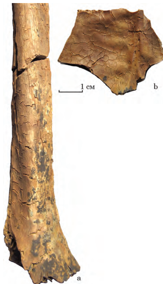
Рис. 4. Зміни, викликані дією вогню: 1 — тріщини на діяфізі плечової кістки; 2 — «кракелпор» на внутрішній поверхні лобної кістки

кого часу. Однак трапляється також і на більш пізніх останках. Допоки про причину цих плям можна лише здогадуватись. Вони можуть бути наслідком розкладання м'яких тканин тіла людини, одягу, або слідами присутності грибків чи інших органічних субстанцій.