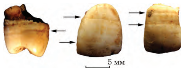
Рис. 3. Гіпоплазія емалі на верхніх премолярі, центральному та боковому різцях (лінії позначені стрілками)

Кістки з поховання 524 мають темно-коричневий та кавовий колір, який є припустимим наслідком контакту поверхні з органічною вистилкою могили. На кістках посткраніального скелету та черепа присутні плями чорного кольору (чорна патина). Таке забарвлення поверхні кісток досить поширене у могилах скіфсь-