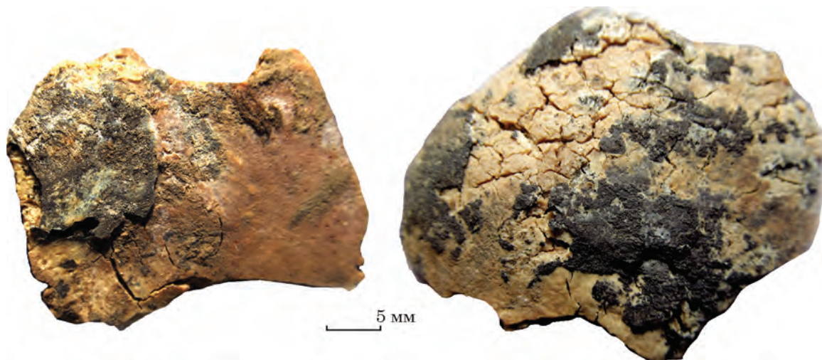
Рис. 6. Плівка муміфікованої тканини на фрагментах кісток черепа

Викликає деякі питання походження неглибокого надрізу на зовнішній поверхні тім'яної кістки, близько потилично-тім'яного шва (рис. 7). Довжина надрізу близько 12 мм, ширина — 0,6 мм. Він має V- або U-подібний перетин, з однією більш покатою викришеною, і другою — здутою стінкою. Дно гладеньке, краї