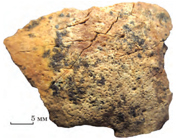
Рис. 2. Ділянка поротичного гіперостозу на черепі підлітка

Закриття метафізарних пластинок (приростання епіфізів до діафізів) є одним з вікових індикаторів, який позначає перехід від підліткового до дорослого віку. У дівчат та хлопців швидкість статевого дозрівання й, відповідно, швидкість формування кісток різняться. Так, приміром час приростання проксимального епіфізу ліктьової кістки коливається у дівчат від 12 до 15, а у хлопців — від 13 до 17 років (Baker et al. 2005, p. 109). Приростання голівки стегнової кістки починається відповідно у 12—16