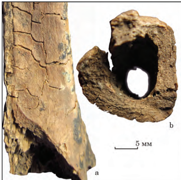
Рис. 5. Посмертні температурні зміни на поверхні плечової кістки: 1 — поверхня перимортального косяго сколу дистальної частини діафізу плечової кістки; 2 — середина діафізу плечової кістки

гих кісток. Ці тріщини є результатом обструкції м'яких тканин тіла під час тривалого термічного впливу (Symes et al. 2008, р. 42—45). Подібні тріщини з'являються на кістках при дуже швидкому їх висушуванні (дегідратації) при високих температурах. На діафізах довгих кісток виявлені сліди посмертних спонтанних переломів. Більшість з них спіральні (рис. 5: а), з дуже гладкою поверхнею злому (рис. 5: б). Такі лінії переломів утворюються у двох випадках — перелом відбувся, коли кістка ще була волога (тобто у час, близький до смерті індивіда), або у випадку розколу кістки по лініях температурних тріщин.