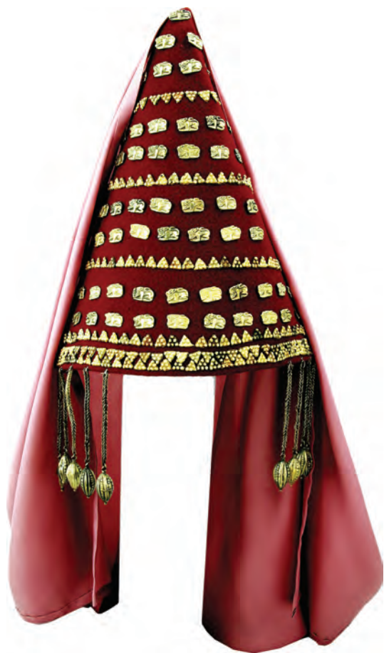
Рис. 4. Головний убір з підвісками

звана «сцена братання» — скіфи з ритонем (рис. 3: 3). Але є відмінність у образному та ідейному наповненні обох композицій: Сахнівської і Бердянської. Йдеться про дзеркало: його зображення нема на фронтальній площині головного убору, крім того, не зафіксовано і серед речей у «схованці». Отже, можливо, декоративні елементи, насамперед, прикраси головного убору, є символами не Аргімпази, а іншого божества життєдайних сил природи — Кібели. Образ хижака з породи котячих, включений до набору оздоб убору, акцентує саме це божество. Символічними є форма убору: алюзія на гору — еквівалент дерева життя, а також оформлення фронтальної частини убору і в сенсі форми — трикутник, і в сенсі змістовного наповнення: антропоморфні, зооморфні образи, геометричні мотиви — є знаками культів родючості (у широкому сенсі).