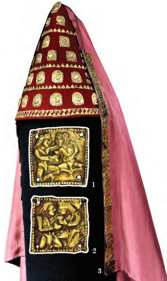
Рис. 3. Аплікації — прикраси покривала: 1 — зображення персонажа, який тримає ритон у правиці; 2 — пластинка із зображенням скіфів, які тримають ритон; 3 — реконструкція головного убору з покривалом

Ще один варіант штампа: скіфи сидять, зігнувши ноги так, що ступні з'єднані. Персонаж зліва обернений на три чверті, а обличчя подане строго в профіль. Волосся трохи скуйовджене, риси обличчя виразні, особливо виділено гачкуватий ніс. Скіф тримає у правиці ритон, а лівою рукою обнімає свого візаві. Персонаж справа сидить прямо, голова повернута вліво. Обличчя видовжене, облямоване пасмами прямого волосся, яке спускається до плечей. Ліва рука скіфа простягнута до посудини, але він її не торкається (рис. 3: 2). Сюжет найчастіше інтерпретують як ілюстрацію до розповіді Геродота про обряд братання (Геродот, IV, 70). Але зображення тільки у загальних рисах відповідає опису церемонії, яку, за свідченням Геродота, провадили скіфи. Ймовірно, зміст сцени варто «читати» в залежності від контексту. Семантику образів на аплікаціях з Бердянського кургану можна розкрити, зіставивши з аналогічними, зображення яких включено в багатофігурну композицію на так званій «пластині Гезе» — знахідці з кургану 2 поблизу с. Сахнівка (Черкаської обл.; Музей... 2004, кат. № 22, с. 377). Сахнівська пластинка (365 × 98 мм) була накладкою на фронтальну частину циліндричної шапочки, схожої на ту, що увінчує голову центральної особи в багатофігурній композиції, вміщеній на поверхні. Є кілька варіантів інтерпретацій сюжету. Деякі науковці вважають, що всі образи, показані на пластині, складають сюжет культово-міфологічного характеру — священний бенкет-жертвоприношення