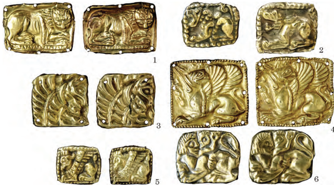
Рис. 5. Золоті пластинки із зображенням зооморфних і міфічних істот: 1 — образ лева; 2 — зображення левиноголового грифона; 3 — протома грифона; 4 — пластинки із зображенням грифона, оберненого вліво; 5 — образ грифона з рогом; 6 — сюжет у гротескному виконанні

рідні: вони відбивають цілий спектр уявлень про перехід з одного світу до іншого. Дослідники не раз відмічали різноманітні артефакти, пов'язані зі шлюбними обрядами у похованнях (Бессонова 1983, с. 115; Яценко 2006, с. 334, 354). У шлюбному ритуалі велике значення мав червоний колір. Він, ймовірно, викликав різноманітні асоціації — кров, вогонь, сонце, тобто, життєдайні образи (Яценко 2006, с. 360, 361).