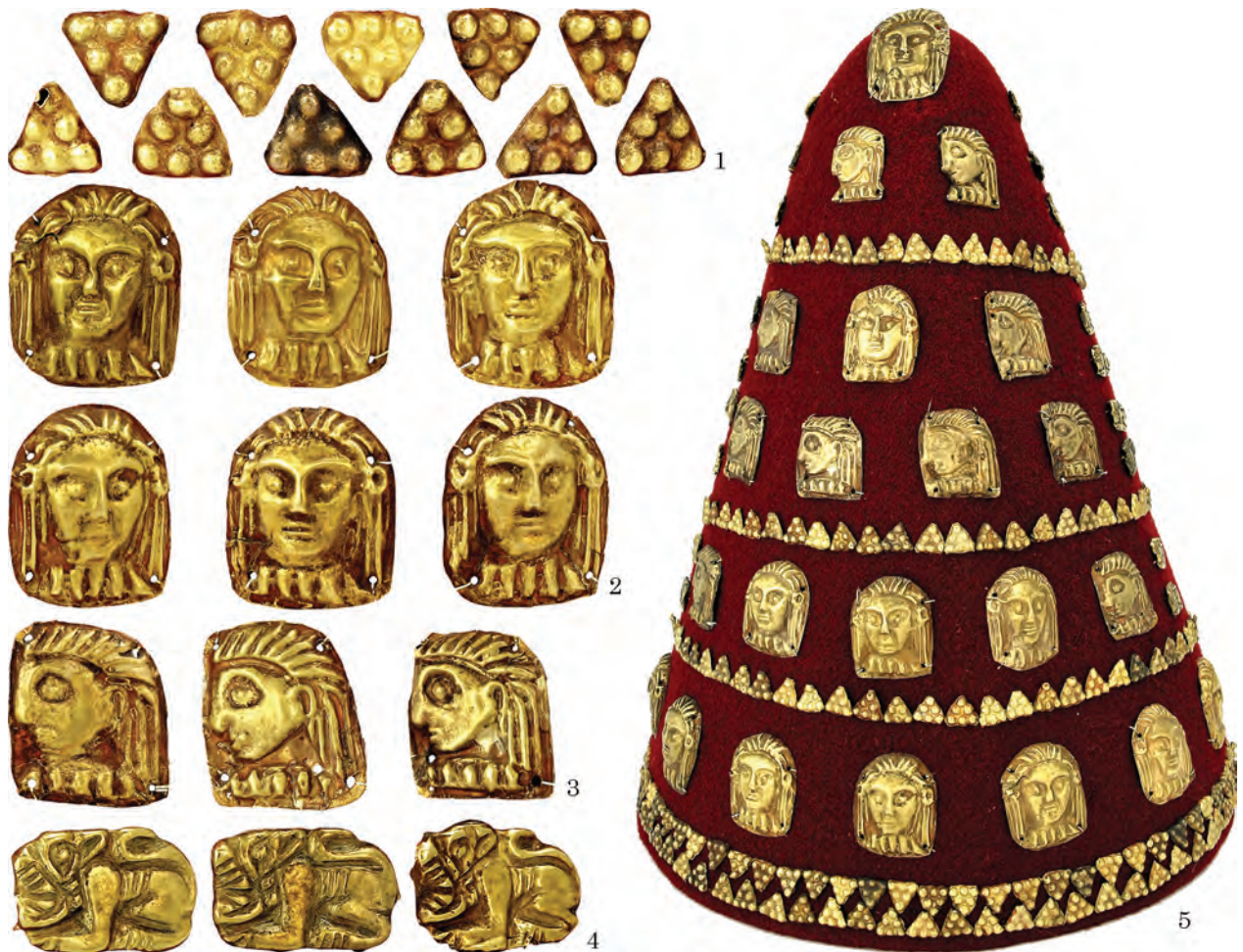
Рис. 2. Декоративні елементи — прикраси головного убору: 1 — пластинки-трикутники з пуансонними візерунками; 2 — портретні зображення анфас; 3 — портретні образи у гротескному стилі; 4 — образ хижака з породи котячих; 5 — реконструкція головного убору

користували для оздоблення золоті прикраси, на яких представлені «портрети»: на відміну від «масок» вони наділені деякими рисами індивідуальної характеристики. Вироби розрізняються між собою художніми особливостями, оскільки виконані за взірцями мистецьких витворів, які походять із кількох виробничих центрів, отже відбивають творчі засади різних майстрів. Трактують жіночих образів у мистецтві Північного Причорномор'я здійснено у греко-скіфському стилі. Серед його характерних рис відзначимо своєрідне поєднання реалізму та примітивізму, гіперболізацію деяких деталей, оригінальне композиційне вирішення сюжетів. Н. Онайко підкреслила, що в творах «варварського» мистецтва особливо велику увагу приділяли зображенню голови (Онайко 1976, с. 173). Це доводять декоративні твори, на яких представлені «портрети» жінок. Мініатюрність виробів не вплинула на детальне відтворення жіночих голівок: вони у головних уборах, з нашійними прикрасами (Клочко 2019, с. 76—79). Більш рідкісними є «портрети», на яких жінки зображені з непокритою головою. Деякі з них узагальнені, нагадують маски.