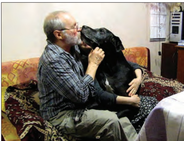
Сімейна улюблениця Джака