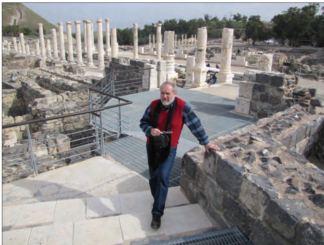
Скіфополіс (Бет-Шеан, Ізраїль). 2011 р.