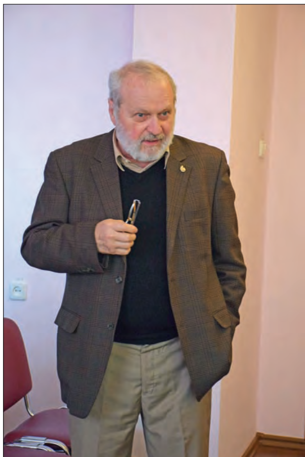
Інститут археології НАН України, на засіданні спецради. 2017 р.