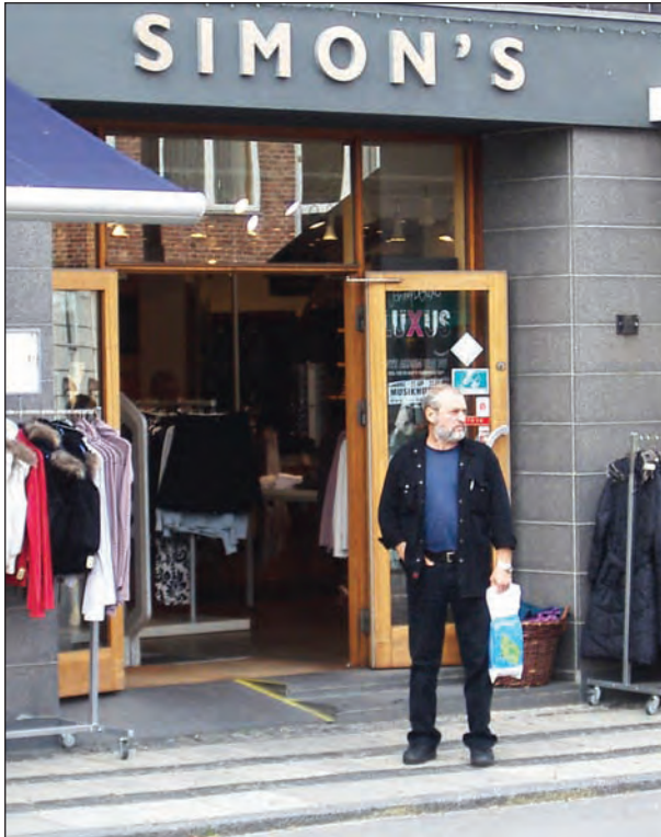
Острів Борнхольм, біля «власного» магазину. 2006 р.