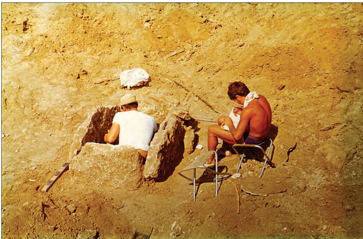
Перший сезон у степу. ХАЕ, курган біля с. Львове. 1973 р.