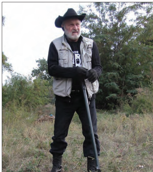
Село Золота Балка, шурфовка. 2019 р.