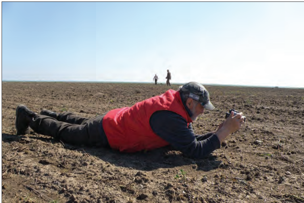
Присивашня, розвідка. 2016 р.