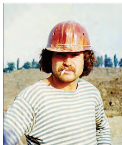
ХАЕ, с. Шевченківка, керівник розкопок скіфського кургану. 1978 р.