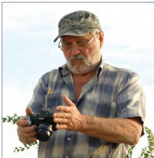
Червоний Маяк, розкопки могильника. 2017 р.