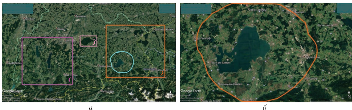
Рис. 2. Супутникові знімки території рекогносцирувального обстеження у ФРН

Блок 3. У межах блока зареєстровані сигнали від нафти, конденсату, газу, бурштину, вуглекислого газу, бактерій, фосфору (жовтого), горючого сланцю, газогідратів. Корінь вулкана 1–6-ї груп осадових порід зафіксований на глибині 470 км. На поверхні синтезу вуглеводнів 57 км зафіксовані сигнали від нафти, конденсату, газу, бурштину, фосфору (жовтого). Відгуки від вуглекислого газу отримані на глибині 57 км. Встановлено факт міграції газу і фосфору в атмосферу