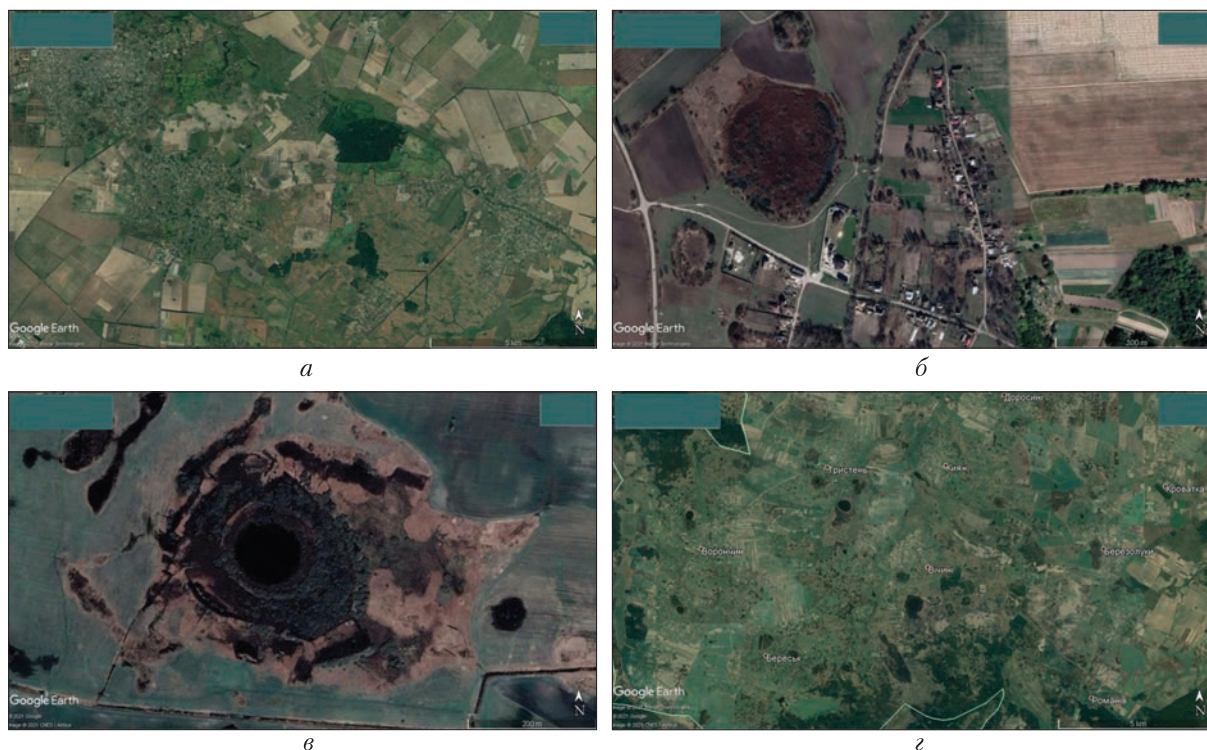
Рис. 4. Супутникові знімки ділянок водневої дегазації в районі Борисполя (а, б) та в Рожищенському районі Волинської області (в, з)

Під час обробки знімка 3, в без центральної частини зареєстровані сигнали від вуглеводнів, бактерій, фосфору (жовтого), мертвої води, лонсдейліту, солі калійно-магнієвої, осадових порід 7-ї (вапняки) групи і магматичних порід 7, 8, 9, 10-ї груп.