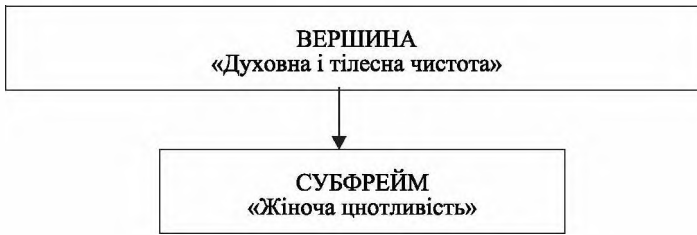
Рис. 4. Фреймова модель гіпоконцепту ДОБРОЧЕСНІСТЬ / ЧЕСНОТА

Мономаха 16 . Доброчесність як іпостась моралі в староруському релігійно-дидактичному дискурсі постає в таких семантичних вимірах: суворе обмеження афективної сфери, прагнення до самовдосконалення, здійснення справ милосердя, збереження душевної і тілесної чистоти, прагнення до істини.