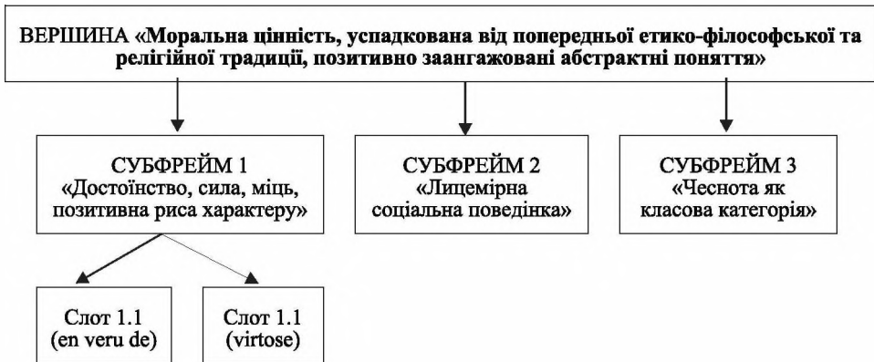
Рис. 2. Фреймова модель гіпоконцепту VERTU

Структура гіпоконцепту VERTU при фреймовому моделюванні набуває такого вигляду: