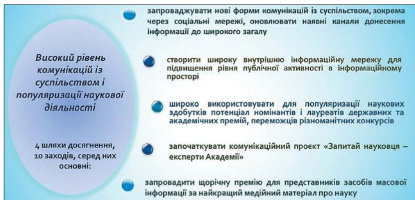
Рис. 6. Шляхи досягнення цілей за напрямом з підвищення рівня комунікацій із суспільством та популяризації науки

прозорого розподілу базового бюджетного фінансування між секціями та між відділеннями НАН України мають бути розроблені та запроваджені відповідні принципи.