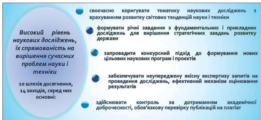
Рис. 1. Шляхи досягнення цілей за напрямом забезпечення високого рівня наукових досліджень

вання НАН України, визначених постановою Президії НАН України від 23.11.2020 № 171 «Про окремі заходи з реформування діяльності Національної академії наук України».