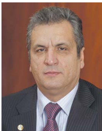
БОГДАНОВ Вячеслав Леонідович — академік НАН України, віцепрезидент НАН України