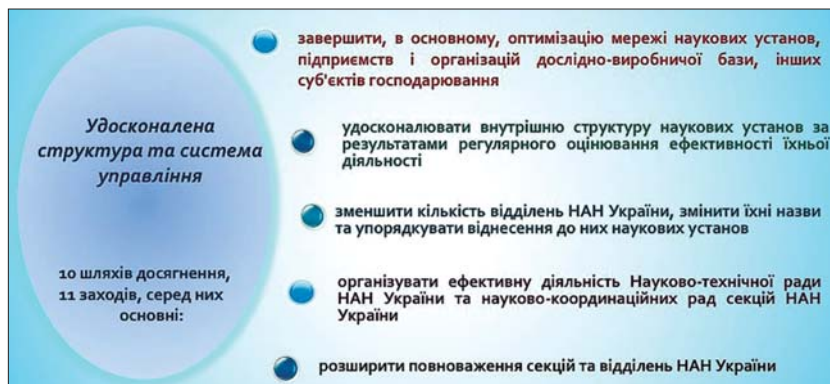
Рис. 4. Шляхи досягнення цілей за напрямом з удосконалення структури та системи управління