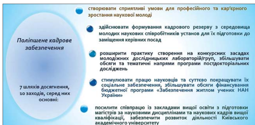
Рис. 5. Шляхи досягнення цілей за напрямом з поліпшення кадрового забезпечення

напрямів, організації міждисциплінарних досліджень.