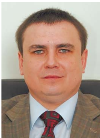
КУБАЛЬСЬКИЙ Олег Нарцизович — перший заступник головного ученого секретаря НАН України — начальник Науково-організаційного відділу Президії НАН України