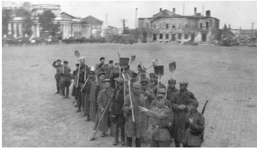
Будівля кінотеатру імені Щорса у часи німецької окупації