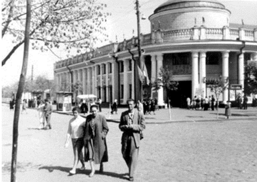
Кінотеатр ім. Щорса у Новограді-Волинському, 1950-і рр. 5