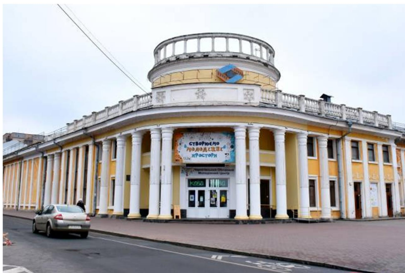
КП «Обласний молодіжний центр», колишній кінотеатр імені Щорса.