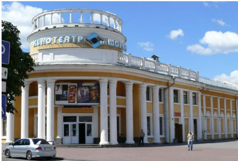
Фото кінотеатру імені Щорса на біографічній сторінці П.Ф. Савича.