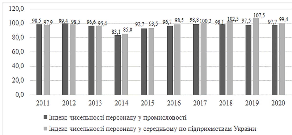
Рис. 3. Динаміка індексів чисельності персоналу у промисловості та в середньому по підприємствам України, у % до попереднього року (сформовано авторами на основі джерела [11])

вже у 2017-2019 роках в середньому по Україні спостерігалось зростання чисельності персоналу підприємств, а у промисловості вона продовжувала скорочуватись. За підсумками 2020 року чисельність персоналу промислових підприємств скоротилась на 2,3% у порівнянні з 2019 роком, а в середньому по підприємствам України кількість персоналу зменшилась лише на 0,6%.