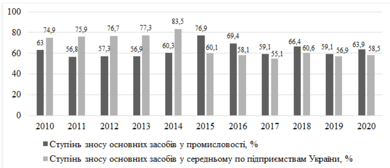
Рис. 1. Динаміка ступеня зносу основних засобів у промисловості та в середньому по підприємствах України (сформовано авторами на основі джерела [11])

На даний час стан забезпеченості підприємств промисловості основними виробничими засобами можна оцінити як незадовільнений, оскільки спостерігається високий ступінь їх зносу (рис. 1).