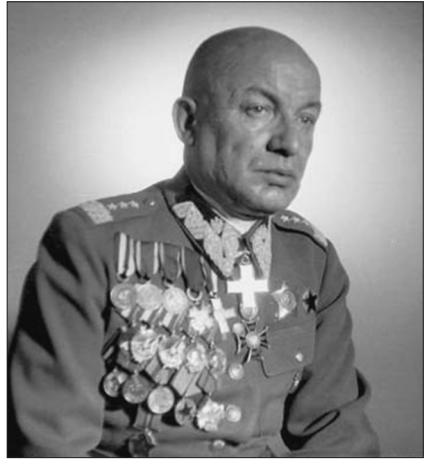
Генерал броні Кароль Сверчевський — заступник міністра народної оборони Польщі

Аж на другий день поляки випадково віднайшли шпиталь (хтось із медобслуги вийшов із криївки) і почали облогу та активні спроби його збройно здобути. На той час у шпиталі було всіх разом 17 осіб (така цифра подана в підпільних звідомленнях) під керівництвом курінного лікаря 'Рата'. Протягом цілодобової шаленої оборони всі вони героїчно загинули. Загибель шпиталю особливо вразивла сотні 'Хріна' й 'Стаха', бо там лікувалися їхні поранені, а лікар 'Рат' дуже часто перебував при цих сотнях. Останні постріли пролунали 23 січня 1947 р. 3