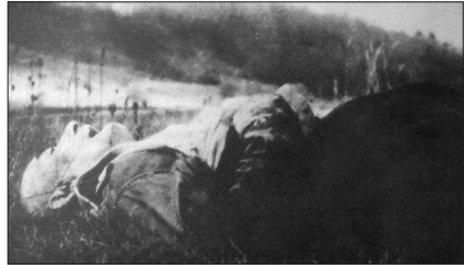
Тіло генерала Сверчевського, вбитого під час перестрілки із сотнею 'Хріна'

Під час повороту до табору 'Хрін' переглядав знімки в польському календарі, щоб устійнити, кого вбито, але остаточно потвердження прийшло аж на два дні пізніше, коли він одержав польські газети 15 . Тут треба згадати про свідчення, що 'Хрін' мав інформацію про плани Сверчевського за-далегідь і тому організував цю засідку. Але різні документи з 1947 р., публікації на цю тему та писання самого 'Хріна' цього не підтверджують. Одне підпільне повідомлення подає, що ціль засідки була перехопити тих, хто знищив шпиталь на Хрещатій 16 . Все-таки, між стрільцтвом поширився міф, ніби 'Хрін' зорганізував засідку, знаючи наперед, що Сверчевський якраз того дня буде їхати тією дорогою.