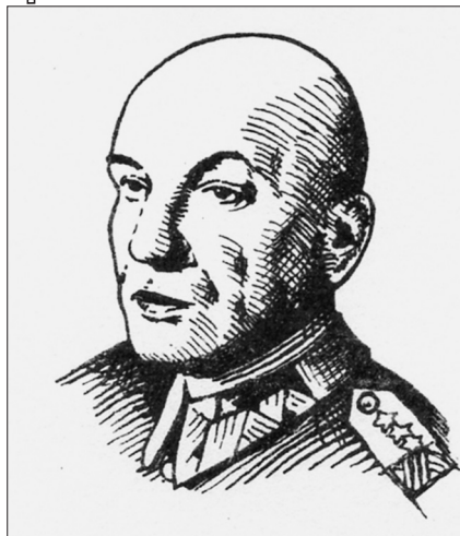
Кароль Сверчевський. Портрет