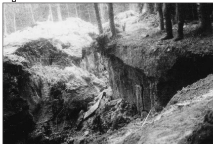
Руїни кривілки-лікарні на г. Хрещатій (Лемківщина), знищеної 23 січня 1947 р.

кодове число «95а», а її чоти номери 513, 514, 515 4 . Весною 1946 р. чисельність сотні зросла до понад 200 бійців, і тому невишколених новобранців відокремлено в окрему вишкільну сотню під командою хорунжого Ярослава Коцьолка-‘Криляча’. Осінню 1946 р. сотню названо «Ударник-8» із кодовим числом «95б», а чоти (їх було тільки дві) нумеровано 522 та 523.