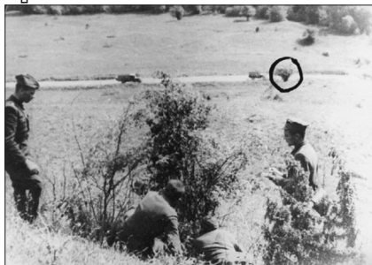
Місце засідки на кортеж Сверчевського, колишнє село Яблінка поблизу Балигорода

кож неfortunно для ворога, бо боєздатними 11 .