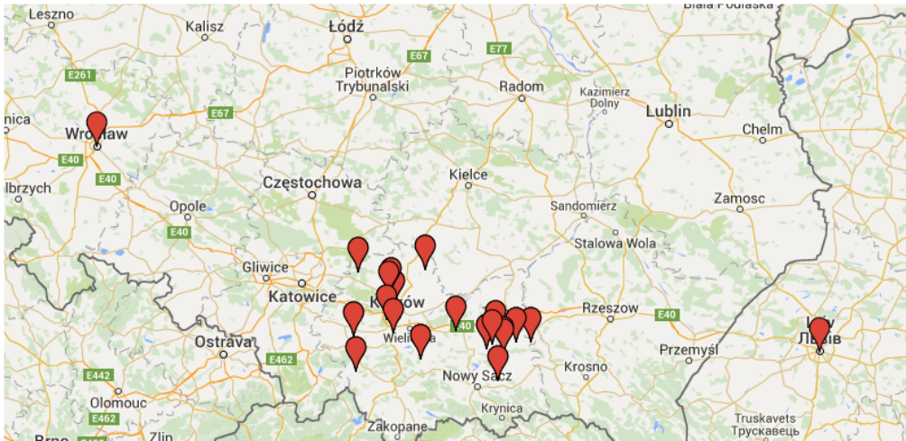
РИС. 2. Пункти виноробства в напрямку Львів – Вроцлав

У табл. 3 наведені назви пунктів виноробства, d_{ai} – відстані до кожного з них від Львова і Вроцлава, а також d_{ib} – відстані від пунктів виноробства до Вроцлава і Львова. Відстані задані в кілометрах і обчислені за допомогою веб-сервісу Google Maps ( https://maps.google.com/ ).