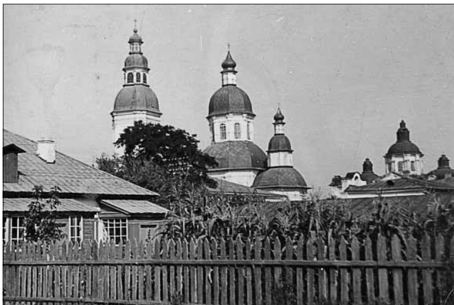
Рис.3. Миколаївська церква з дзвіницею та Троїцький собор. Фото 1953 р.