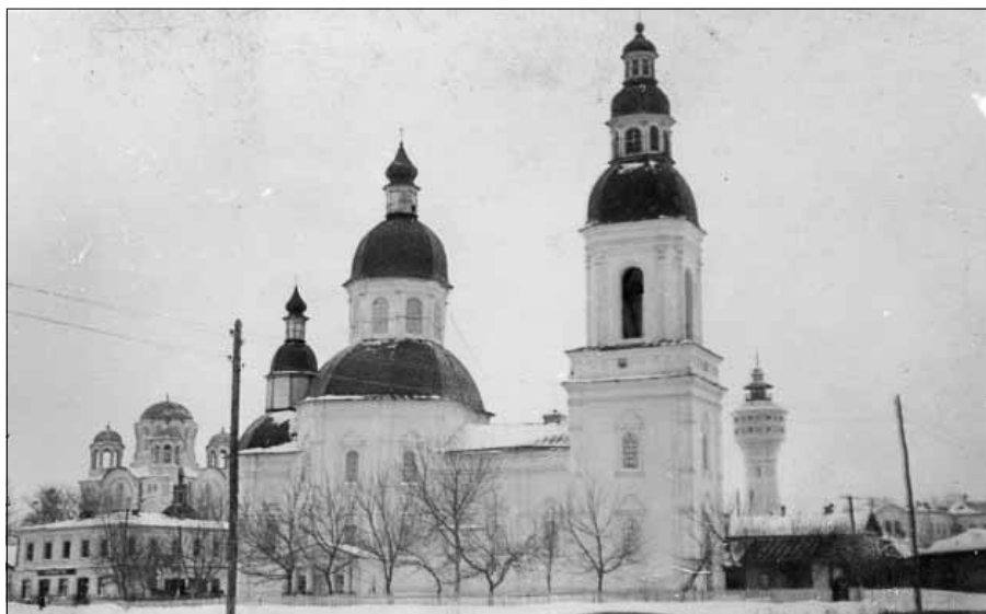
Рис. 1. Миколаївська церква з дзвіницею. Фото 1953 р.

дають архітектурну та культурну спадщину України. Вивченням збережених архітектурних пам'яток присвятили свої дослідження М. Макаренко [1], П. Фомін [2], Ф. Ернст [3], В. Січинський [4], С. Таранушенко [5], Г. Логвин [6], В. Вечерський [7] та ін. Їх роботи дають можливість розширювати, доповнювати попередні напрацювання українського архітектурознавства.