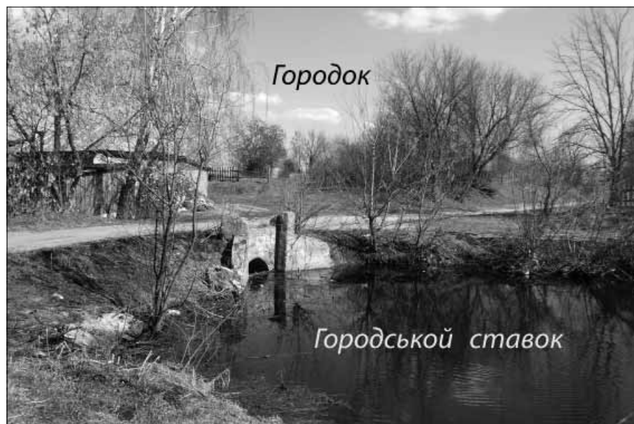
Рис. 2. Городок

Михайлівська однобанна церква (Рис. 1) стояла на цегляному фундаменті, зовні була обшита тесом і покрашена білою масляною фарбою, усередині також покрашена білою масляною фарбою та розписана живописом. Зверху була покрита залізом, покрашеним зеленою масляною фарбою. Довжина церкви разом із дзвіницею становила 15 сажнів (32 м), ширина – 8 і \frac{3}{4} сажні (17,6 м), висота до верху карниза – 3 сажні (6,4 м). Великих вікон нараховувалося 26 шт., малих – 4 шт., дверей зовнішніх стулчастих, обшитих залізом, – 1, одинарних – 1, внутрішніх – 1; дверей зовнішніх стулчастих