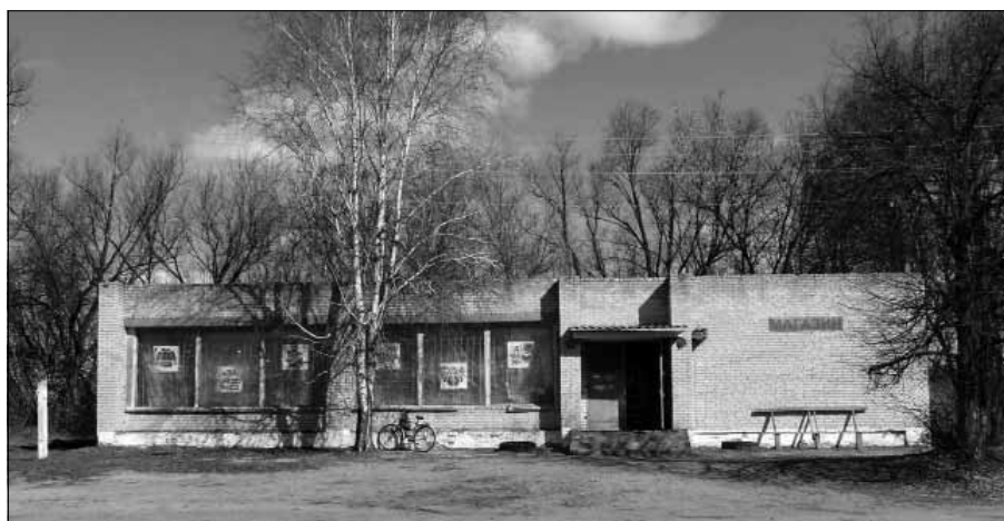
Рис. 5. Магазин райспоживспілки на місці згорілої церкви

матеріалу церковно-причтовий дім (квартира для проживання псаломщика). Його довжина становила 3 сажні (6,4 м), ширина – 2 і 2/3 сажні (5,8 м), висота – 1 та 1/3 сажні (2,8 м). Дім був критий соломною, мав 5 вікон (1 x 0,6 м), троє дверей одностулчастих, піч руську та голландську грубку. При домі були рублені сіні та чулан (5,8 x 4,3 x 2,8 м). Страхова вартість дому становила 100 руб. [8, арк. 162].