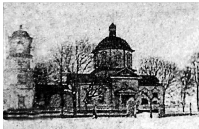
Рис. 1. Свято-Михайлівська церква у с. Собич. Фото 1934 р.

31 березня 1671 р. архімандрит Новгород-Сіверського Спасо-Преображенського монастиря Михайло Лежайський надав Івану Голоденку осадний лист на