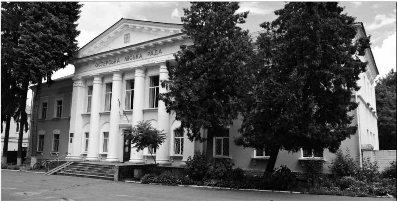
Рис. 8. Адміністративна будівля, 1950-ті рр., вул. Незалежності, 21. Об'єкт культурної спадщини, що пропонується до взяття на державний облік за видом «архітектури»

ський міжвоєнний 1920-х рр. У соціально-економічному та політичному відношенні вони ґрунтовно відрізняються один від одного, проте в містобудівному та архітектурно-аспектах суттєвих змін у розвитку міста не відбулося.