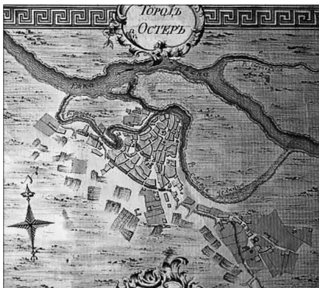
Рис. 10. План Остра 1780 р. // Карта Черниговской губернии с разделением уездов и с расположением в круге оной уездным городам планов и табелей показывающих расстояние оных и число селений спросив и народа [1784]

них протягом останніх років, але не облікованих об'єктів археології, що потребують взяття на державний облік.