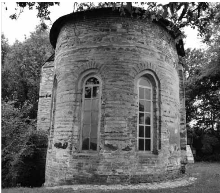
Рис. 1. Юр'єва божниця, 1098 р. Пам'ятка архітектури національного значення

II етап – кінець XI – середина XIII ст. Етап об'єднаний найважливішою характерною рисою – функціонування Городця на Острі як важливого стратегічного пункту, одного з найкраще уфортифікованих на Середньому Подніпров'ї. Він відіграв важливу роль як у захисті цих земель від половецьких нападів,