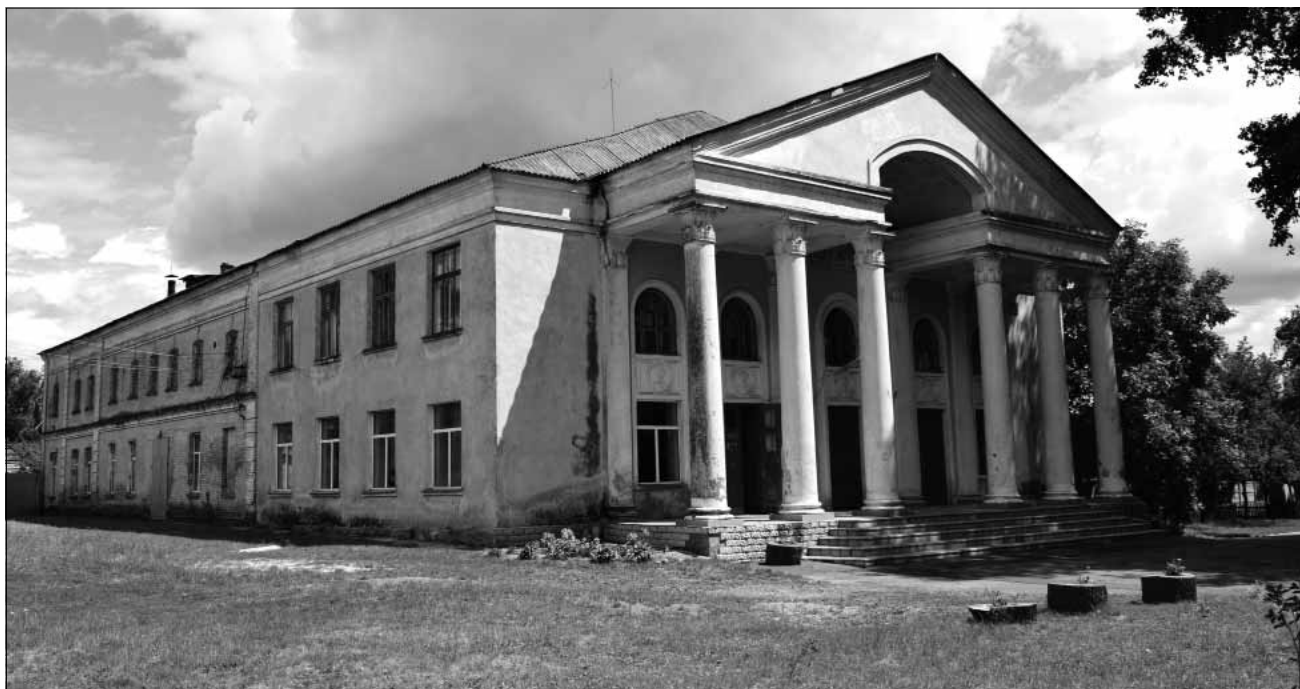
Рис. 7. Будинок культури (частково – колишня будівля синагоги), кінець XIX ст., 1950-ті рр., парк ім. Зимовця. Об'єкт культурної спадщини, що пропонується до взяття на державний облік за видом «архітектури»

ім паралельні. Таким чином утворились відносно рівні за розмірами підпрямокутні у плані квартали. Було розплановано дві площі – композиційні вузли. Площа, акцентована церквою св. Михаїла, була значно більшою в розмірах і набула статусу головної площі міста, що було підкреслено розташуванням на ній адміністративних будівель та навчальних закладів. На південній околиці міста (фактично за межами селитебної території) влаштували ще одну площу, найбільшу за розмірами, – Ярмаркову.