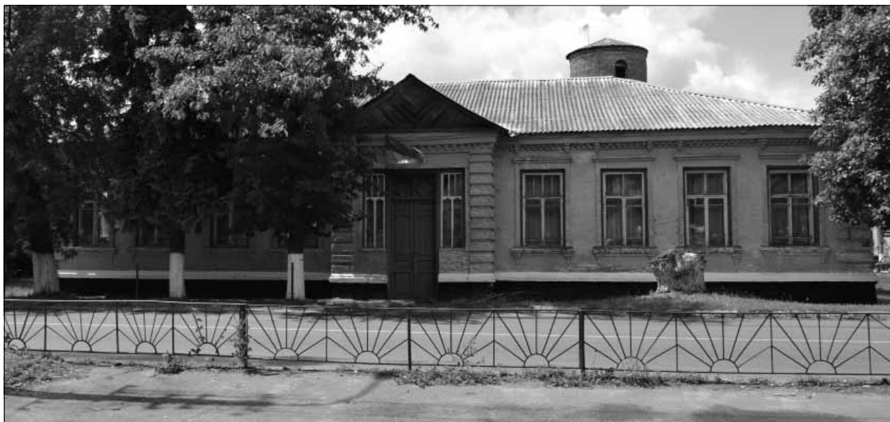
Рис. 4. Будинок міської управи, 1917 р., вул. Незалежності, 42. Пам'ятка історії місцевого значення