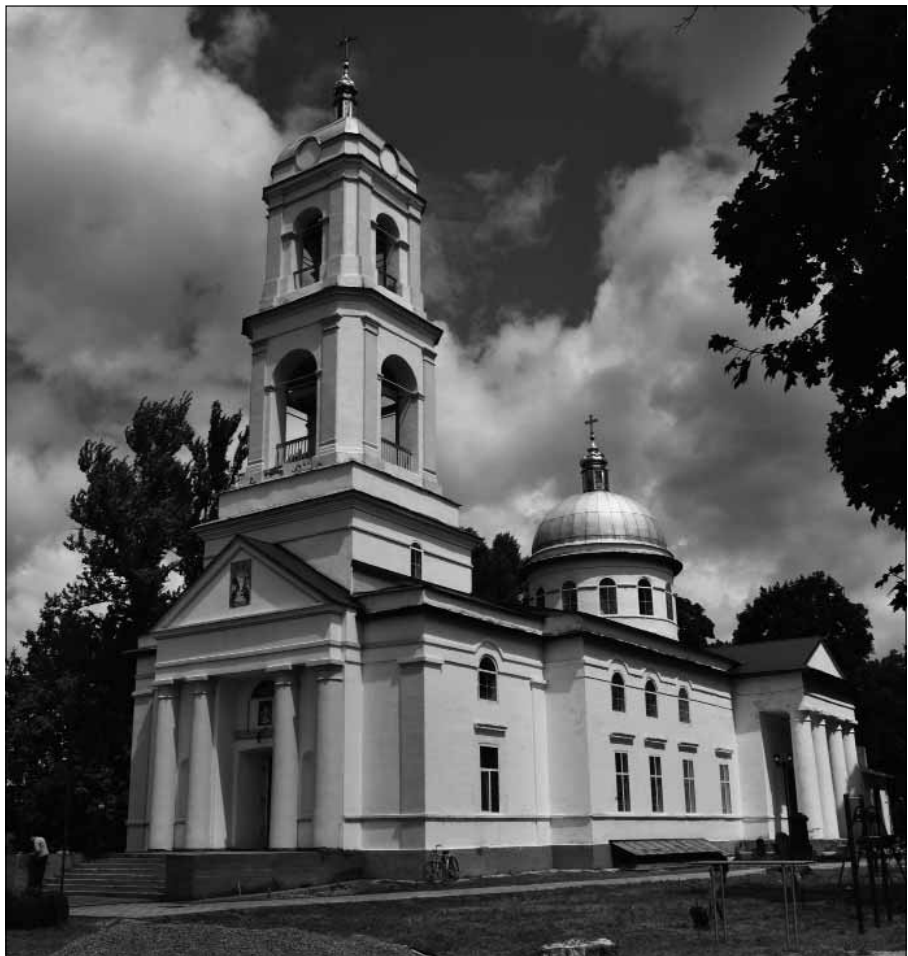
Рис. 6. Воскресенська церква, кінець XVIII ст., XIX ст., вул. Незалежності, 1. Об'єкт культурної спадщини, що пропонується до взяття на державний облік за видом «архітектури»

V етап – кінець XVII – кінець XVIII ст. Початок цього періоду позначений зміною структури і розмірів укріплень Остра. Вони і надалі залишались дерев'яно-земляними. Проте замкові укріплення занепали і припинили своє існування – імовірно, у результаті природного процесу, підмиваючись водами Десни, але, можливо, і в ході військових дій, зокрема 1670-х рр. міські укріплення якийсь час ще продовжили існувати (зафіксовані документом 1690 р.), проте втратили своє стратегічне значення, оскільки на південь від них були зведені дві нові лінії укріплень (вали) – орієнтовно, за трасами сучасних вул. Соборної та Ю. Збанацького. Залишки останніх простежуються на планах міста 1780-х рр. [10]. Таким чином, місто значно збільшується територіально, ускладнюється його структура – воно стає двочасним. Кожна зі складових має свій композиційний вузол та архітектурно-просторову композицію. Композиційним вузлом першої, більш північної та стародавньої укріпленої, частини була площа, акцентована, вірогідно, Воскресенською церквою. Неповдалі від неї спорудили дерев'яну церкву св. Петра і Павла. Композиційним вузлом другої, південної частини, була площа, більша у плані за охарактеризовану вище, можливо, торговельного призначення. Вона, імовірно, була акцентована церквою св. Михаїла. Південніше розташовувалась церква св. Іоанна Предтечі [21, с. 59]. На цьому етапі були продовжені містобудівні традиції попереднього етапу – більшість вулиць залиша-