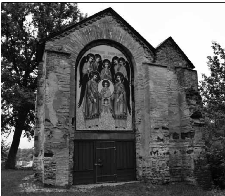
Рис. 2. Юр'єва божниця, 1098 р. Пам'ятка архітектури національного значення