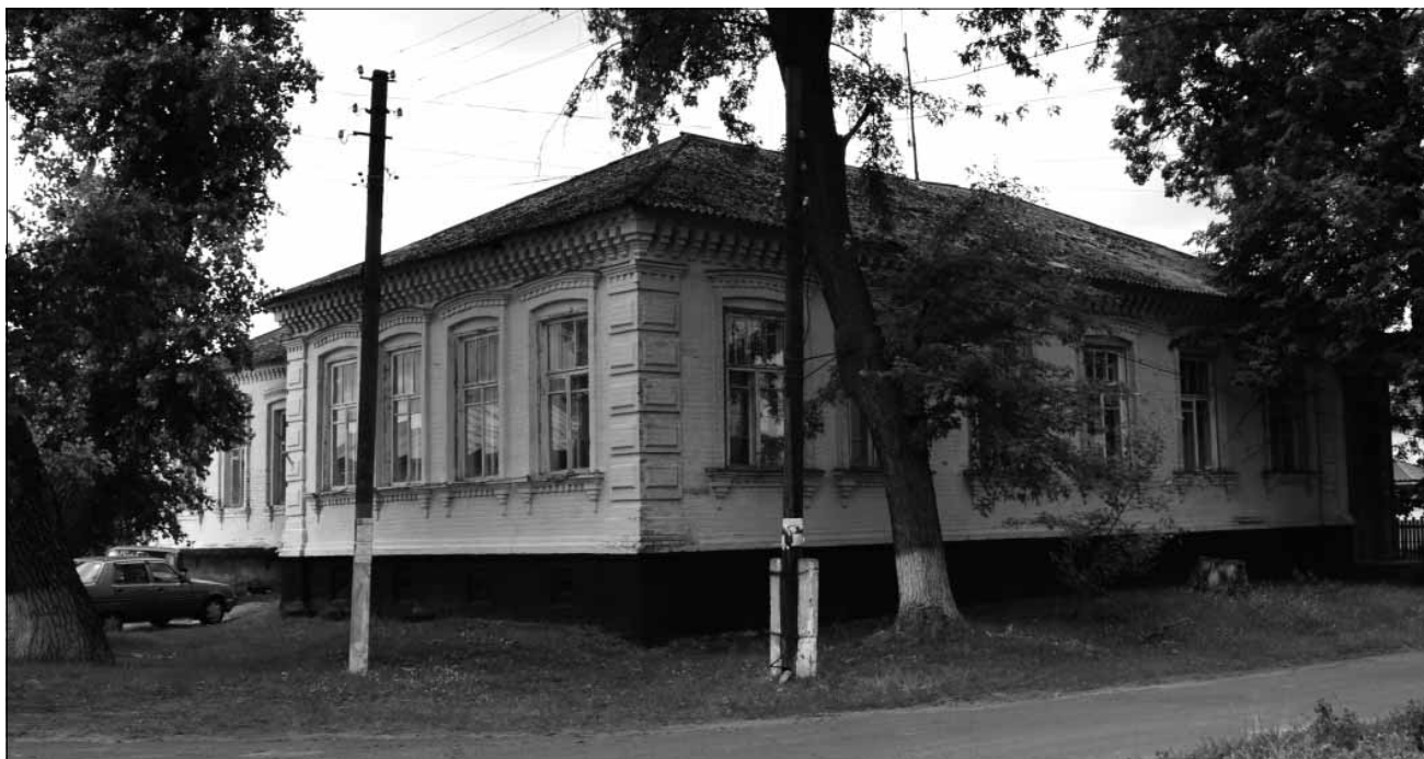
Рис. 9. Будинок житловий, кінець XIX – початок XX ст., вул. Революції, 38. Об'єкт культурної спадщини, що пропонується до взяття на державний облік за видом «архітектури»

возваного в історичному середмісті та Успіння Пресвятої Богородиці на історичному передмісті Татарівщина. Цим було збагачено архітектурне середовище та архітектурно-просторову композицію історичної частини міста, відроджено традицію існування тут культових споруд.