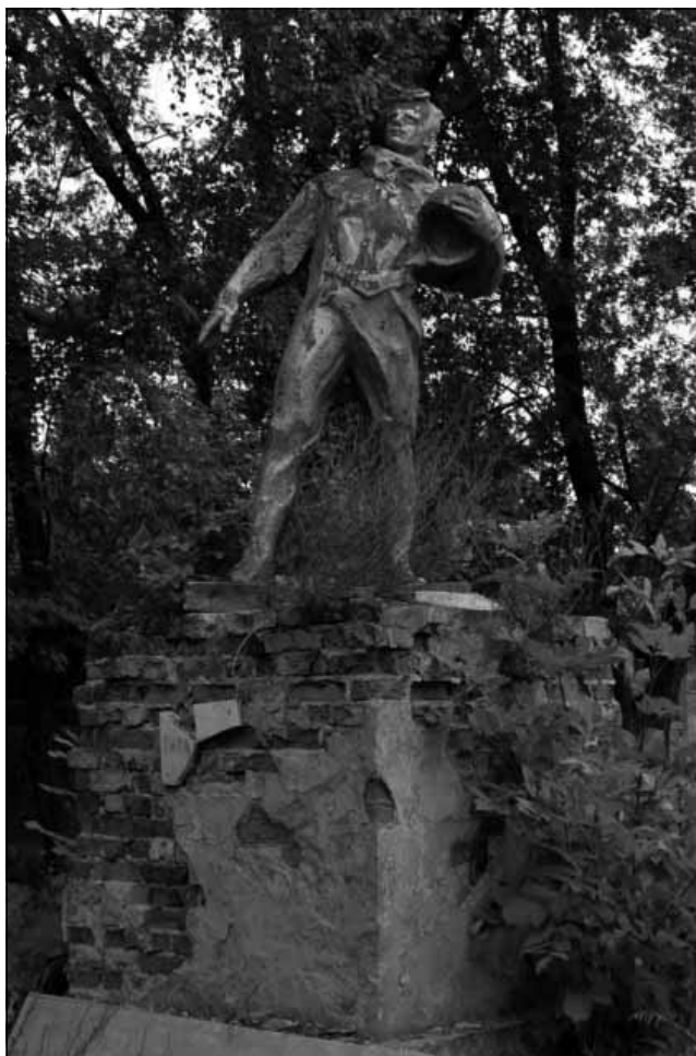
Рис. 5. Пам'ятник Ю.О. Гагаріну, 1934–1968 рр., 1967 р. Пам'ятка монументального мистецтва місцевого значення