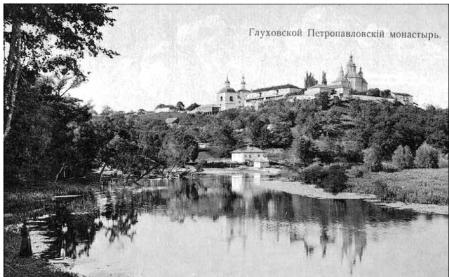
Рис. 1. Общий вид Глуховского Петропавловского монастыря. Открытка издания Я.К. Фесика

Судьбы братьев сложились по-разному, однако, насколько позволяют заключить записи в Помяннике (Си-