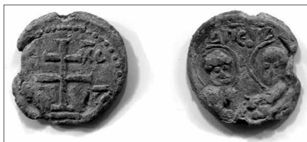
Рис. 4. Булла (вислая печать), найденная в 2017 году на Юрьевом городище

Здесь напрашивается ещё одна параллель: отец обоих