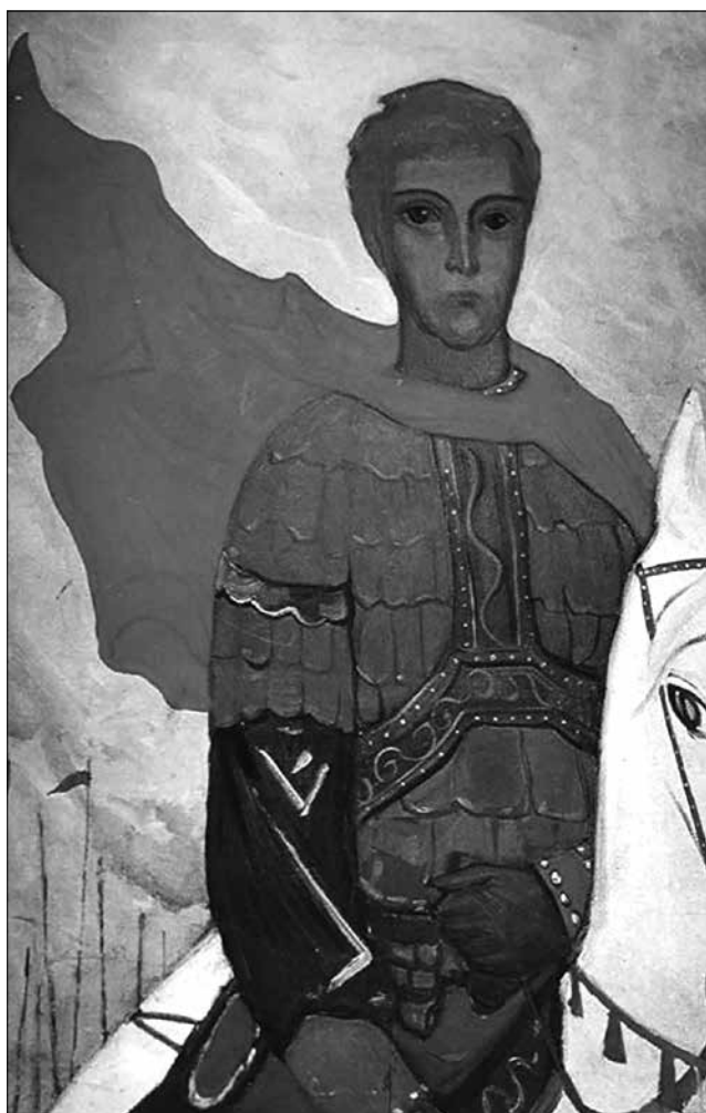
Рис. 3. Князь Владимир Игоревич Путивльский. Художник Илья Глазунов

Кончака; Анастасией в крещении) и сыном Изяславом (Филиппом в крещении).