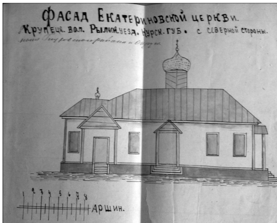
Рис. 1. План фасаду молитовного будинку у с. Катеринівці (1924 р.)

справи церкви, стали нормою політики радянської влади.