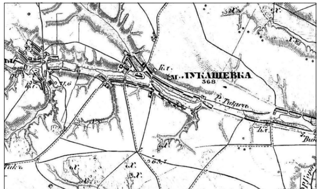
Рис. 1. Містечко Лукашівка Липовецького повіту Київської губернії на трьохверстній мапі Російської імперії 1868 року

Так, у праці Л.І. Похилевича «Сказания о населенных местностях Киевской губернии» за 1864 рік зазначається наступне: «Лукашевка, местечко при соединении ручья Юшки с другим безыменным, образующими двумя прудами пространный полуостров, на коем и расположено местечко. Жителей обоего пола: православных 1661, римских католиков 5, евреев 812; земли 3522 десятины; в 50-ти верстах от уездного города. В местечке есть замковище длиною в 50, а шириною в 30 сажень. На нем стоит кирпичный одноярусный дом. До 1768 года замок обнесен был палисадом, который разорен поднявшимися жителями, в эпоху, известную под именем колиивщины. До 1854 года местечко принадлежало княгине Марцелине Чарторийской, постоянно живущей за границую, а в