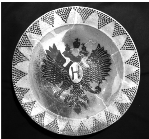
Рис. 3. ПКМВК 91405 Кс 5062. Тарілка «одиначка». 1889–1919 рр. Автор І.С. Гладиревський. Відреставрована Т.Г. Клименко

1. ПКМВК 9762 Кс 638. Миска «одиначка». 1889–1919 рр. Тло – коричневе. Орнамент на вінцях: зубчики. На дзеркалі: два стилізовані дерева життя із гронами винограду, що зростаються кронами на денці. Кольори орнаменту: жовтий, білий, зелений, синій. На денці клеймо: «ГЛАДЫРЕВСКИЙ. ОПОШНЯ». Глина, полива; формування на гончарному крузі, обрізання, сушіння,