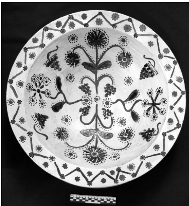
Рис. 2. ПКМВК 91319 Кс 5040. Миска «одиначка». 1889–1919 рр. Автор І.С. Гладиревський. Відреставрована Н.Г. Кондратенко

добірка столового та декоративного посуду, пічних кахлів і цегли. Більшість експонатів належить до довоєнного зібрання. Незважаючи на те, що значну кількість експонатів у 1941 р. було евакуйовано до Уфи, Красноярська, Свердловська й Тюмені, багато керамічних предметів залишилось в окупованій Полтаві і згоріли під час пожежі, що практично вщент знищила музей у 1943 р., або були вивезені до Німеччини [10, с. 43]. Після війни майже всі вивезені вироби повернулись дуже пошкодженими, внаслідок чого деякі з них залишили як науково-допоміжний матеріал разом із так званим «горілим фондом». У пожежі 1943 р. було знищено й значну частину фондovo-облікової документації, тому достеменно встановити джерело надходження експонатів довоєнного періоду здебільшого неможливо.