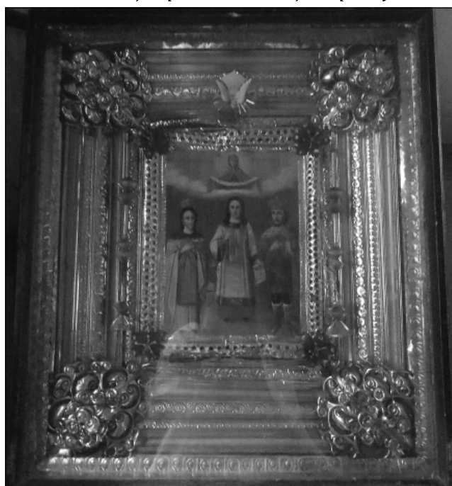
Рис. 3. Ікона Покрови Пресвятої Богородиці, с. Помоклі Переяслав-Хмельницького району

дійшла до НІЕЗ «Переяслав» в 1980 році (Рис. 3.).