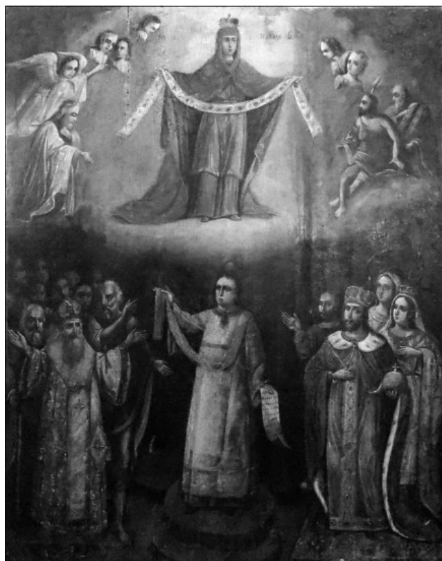
Рис. 2. Ікона Покрови Пресвятої Богородиці, с. В'юнище Переяслав-Хмельницького району

3. Ікона «Покров Пресвятої Богородиці». Зверху на сіро-блакитному фоні, в хмарах, зображена поясна Мати Божа в блакитному хітоні, червоному мафорії, яка тримає в руках омофор. Внизу стоять: зліва – цариця Єлена в світло-блакитному хітоні, рожевому мафорії, на голові корона; справа – цар у військових обладунках, зверху накинута царська пурпурна мантия з коміром із горностая. Між ними зображено Єпіфанія, учня Святого Андрія, в світло-коричневому стихарі і червоному підряснику, який в одній руці тримає червоний омофор, в іншій – сувій. Киот дерев'яний, зі склом. Всередині – фольга. XIX століття. Село Помоклі Переяслав-Хмельницького району. На-