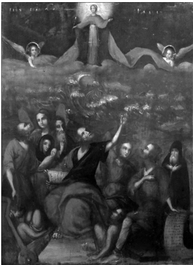
Рис. 4. Ікона Покрови Пресвятої Богородиці, м. Переяслав-Хмельницький

чя повернуті до Богородиці. Над двома янголами і Марією – дерев'яні наліплені німби. Кінець XIX століття. Переяслав-Хмельницький. Надійшла до НІЕЗ «Переяслав» в 1975 році (Рис. 4.).