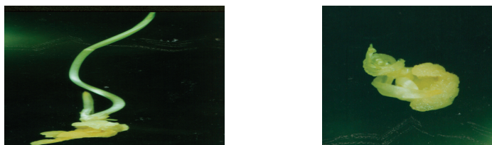
Рисунок 1. Образование каллуса в период прорастания зародыша: а-каллус в основании проросшего зародыша; б - аномальное прорастание зародыша на фоне каллусогенеза.