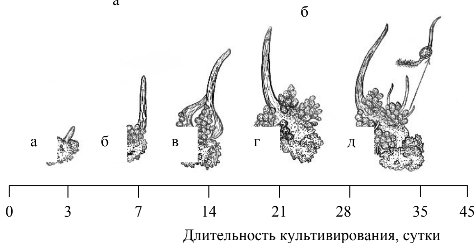
Рисунок 2. Спектр новообразований на средах с 2,4-Д: а - начало прорастания и образование раневого каллуса; б, в - образование на coleoptile глобул; г - формирование эмбриогенного и ризогенного каллусов; д - прорастание эмбриоидов.