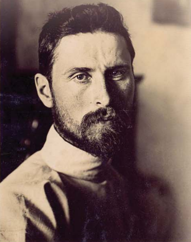
Портрет Степана Яремича. 1900. Із фондів Національного художнього музею України.

Його називали найвидатнішим, блискучим знавцем мистецтва, додаючи слова "яких нараховуються одиниці", людиною енциклопедичних знань, першокласним діячем культури. А директор Державного Ермітажу академік Борис Піотровський (1908–1990) відзначав: "С. П. Яремич — цілковито значуща, цікава і колоритна фігура у художньому світі" [1]. Степан Петрович завдяки природним здібностям, знанням, постійній цілеспрямованій праці опинився в числі перших трьох співробітників