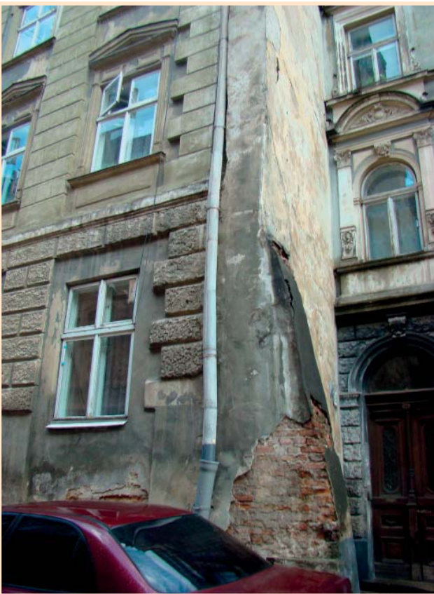
Бул. Вірменська, 30.

їхніми алеями. Мабуть, саме камені Львова, його музеї значною мірою сприяли вибору мого життєвого шляху, виховали мої мистецькі смаки і уподобання.