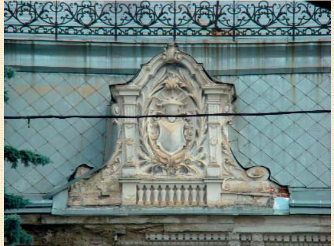
Вул. Пекарська, 19.

обурює, і дивує! Місто Лева завжди славилось висококваліфікованими реставраторами. То де ж вони поділися, що роблять, за які кошти існують?!