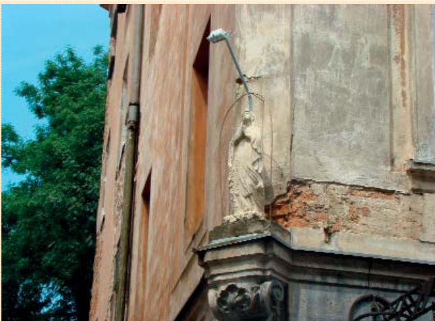
Бул. Вірменська, 13.

І за Австро-Угорщини, і за Польщі, і за часів Радянського Союзу влада міста намагалася зберегти його історичне обличчя. Чорний колір башти Корнякта був обов'язковим елементом краєвиду міста з оглядового майданчика Високого замку, так само, як і крилатий венеціанський лев на фронтоні будинку на площі Ринок й вистукана дзвінниця костелу Кларісок на початку Глинянського шляху. Сьогодні фасади будівель на площі Ринок пофарбовано в усі кольори веселки. Та чи було так у XVI столітті? Башта Корнякта стоїть біла-біленька. Але ж відомо, що білі стіни навмисно фарбували спеціальним розчином, щоб мури набули чорного чи темнокоричневого кольору.