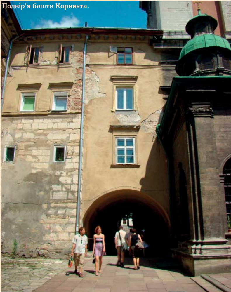
Подвір'я башти Корнякта.

Культурне надбання міста є безцінним. Картинна галерея, унікальний історичний музей, його філії: музеї зброї, меблів, природничий музей, етнографічний музей, музей-аптека, численні собори, церкви, костели XIII–XVIII ст. створюють неповторний колорит. А такі парки Львова, як Стрийський, Залізні Води, Погулянка назавжди залишаються у пам'яті тих, хто хоч раз прогулявся