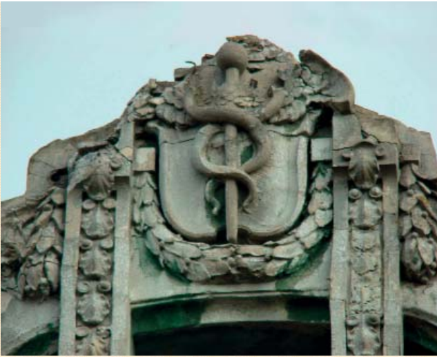
Вул. Городоцька, 87.