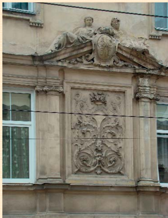
Вул. Франка, 2.