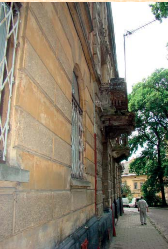
Вул. Короленка, 15.

Гроші на реставрацію статуї діви Марії знайшлися, а ось потинькувати поруч – ні. На вулиці Короленка під шаром фарби просвічують ще польські написи (буд.№ 11). Можливо, є сенс їх відреставрувати як частинку польського Львова. На тій же вулиці балкони у будинку