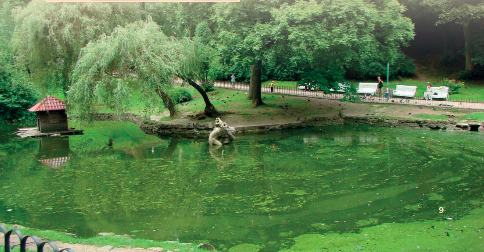
Ставок у Стрийському парку.