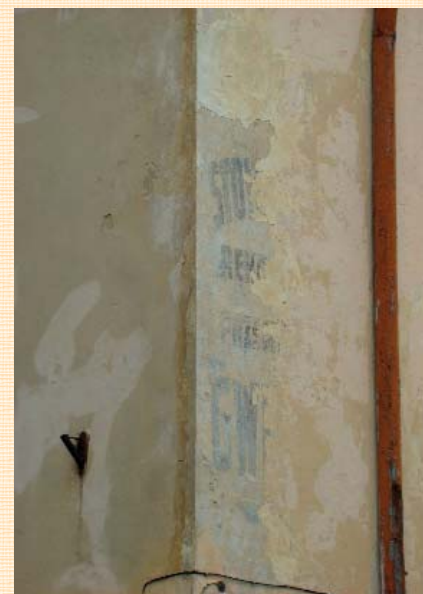
Бул. Короленка, 11.

На подвір'ї над брамою, де знаходиться каплиця Трьох Святителів, ще три роки тому на моїх очах впав шар тинька (метра півтора довжиною) ледь не вбивши людину, що проходила попід брамою. У цьому році стіна вже в трьох місцях обвалена й позбавлена тинькування. І це подвір'я постійно відвідують туристи з різних країн, які йдуть до каплиці! На вулиці Вірменській поруч із свіжопофарбованими будівлями світять цеглою, як ребрами, будинки із фронтонами, що обвалилися.