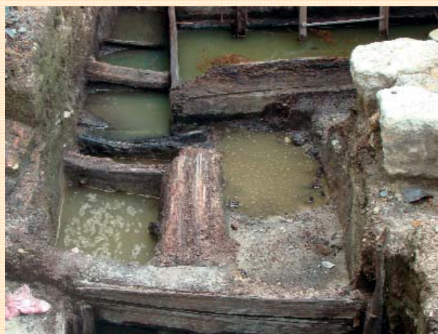
Вул. Федорова, 20-28.