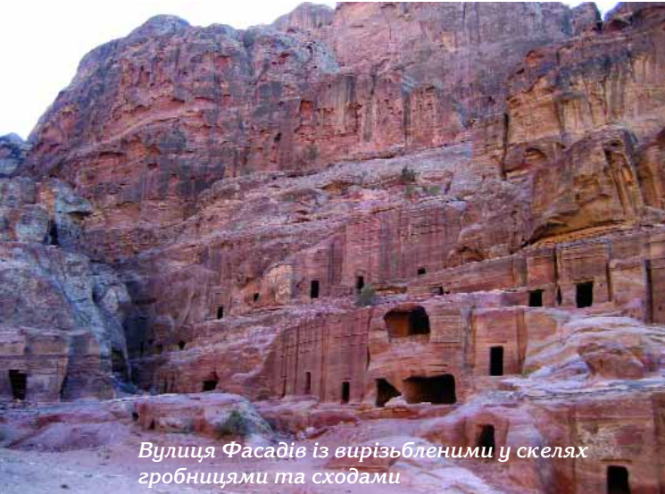
Вулиця Фасадів із вирізьбленими у скелях гробницями та сходами

1200 м) і глибока (до 100 м) ущелина Сік, у скелях якої вирубано канал — давній водогін, ніші для статуй богів і самі статуї. Дорога в ущелині і вулиці Петри вимощені бруківкою. На виході із Сіка вражає красою і величчю рожево-червона скарбниця Аль-Хазне, вирізана у скелі, споруджена як гробниця короля у I ст. до н.е. й оздоблена колонами, статуями богів. У подібному переплетінні грецьких та єгипетських елементів виконані й будівлі вулиці Фасадів з гробницями (Королівськими, Урновими, Шовковою, Коринфською, Палацовою, Сикста Флорентинуса, іншими), сходами, будинками у скелях, театром із 33 рядами, висіченими у скелі, розрахованими на 3,5 тисячі глядачів (у цьому театрі в жовтні 2008 року виступили видатні співаки Пласидо Домінго і Хосе Каррерас з гала-концертом у пам'ять Лучано Паваротті). Поряд розташовано місця для громадських зібрань — Суд справедливості з в'язницею, Німфеум — фонтан з джерелом, Триумфальна арка II ст.н.е.