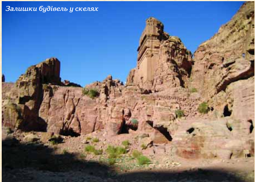
Залишки будівель у скелях