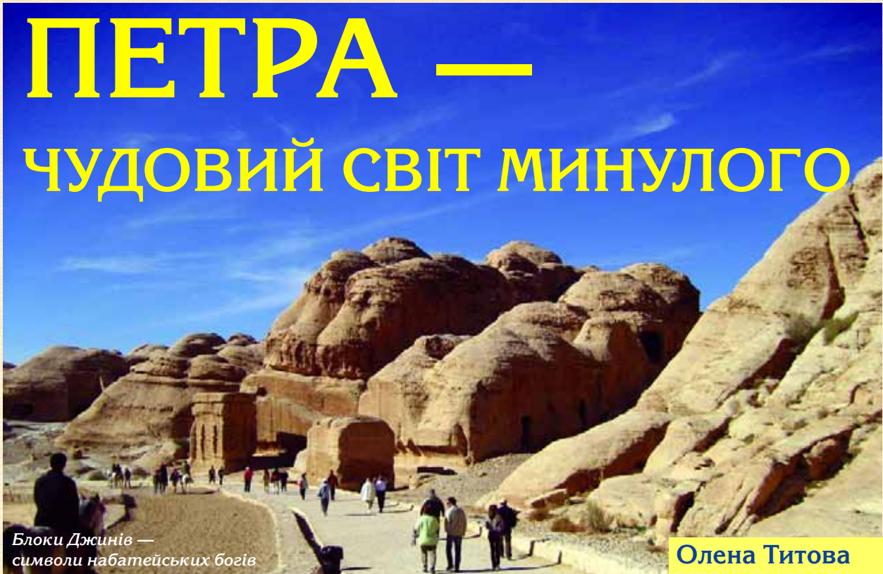
Блоки Джинів — символи набатейських богів