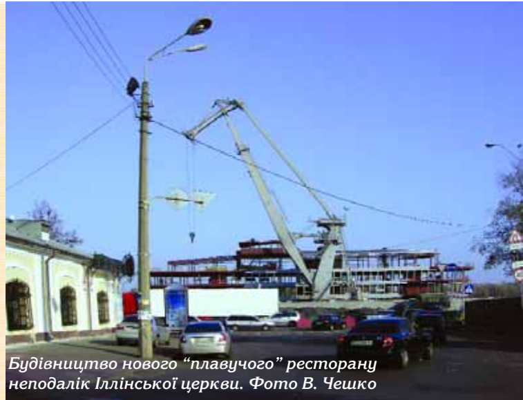
Будівництво нового «плавучого» ресторану неподалік Іллінської церкви.

Відтоді минуло 12 років, за цей час Київ втратив близько 100 пам'яток історії та культури, в тому числі й національного значення, і одержав понівечене історичне середовище. Ось лише декілька прикладів сучасного стану Подолу. Повністю втрачена історична забудова Гончарів та Кожум'як, знесені унікальні пам'ятки — двоповерховий житловий будинок початку XIX ст. на вул. Борисоглібській, 13, житлово-торговельний будинок 1850 року архітектора І. Станзані на вул. Набережно-Хрещатицькій, 5/13, знесено пам'ятку 1912 року арх. О. Вербицького на вул. Набережно-Хреща-