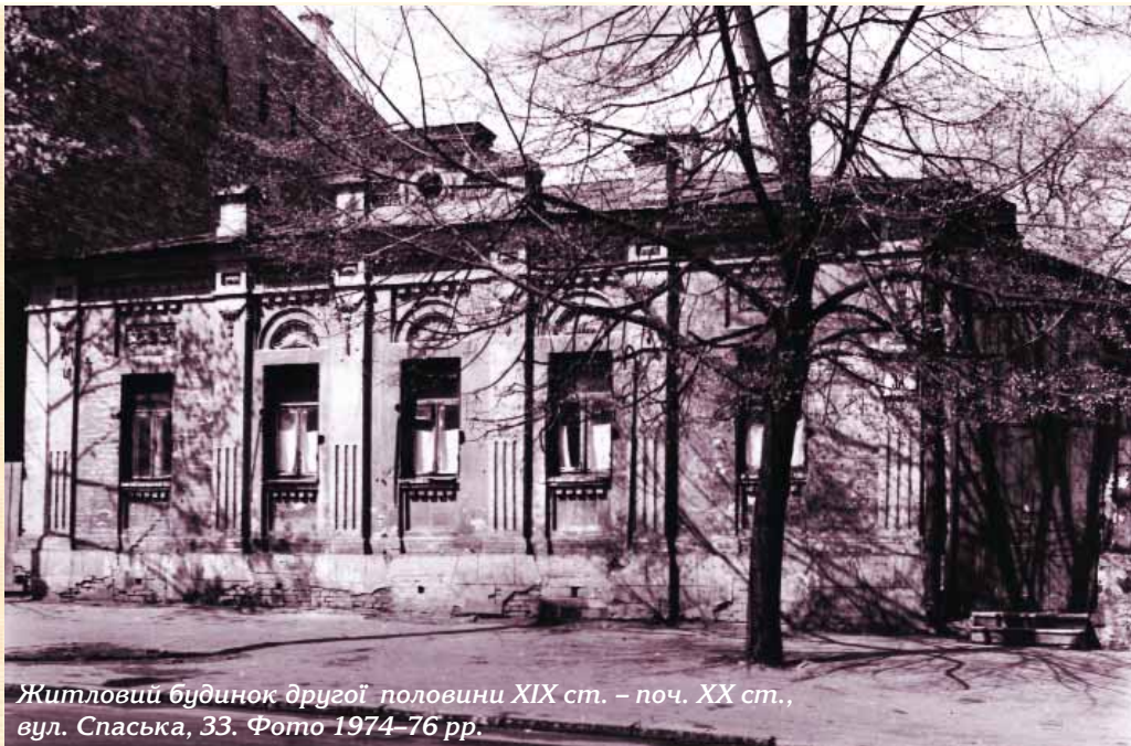
Житловий будинок другої половини XIX ст. – поч. XX ст., вул. Спаська, 33. Фото 1974–76 рр.

Отже, інвентаризацію проводили не за вулицями, а за кварталами. Вона повинна була здійснюватись у 2 етапи: