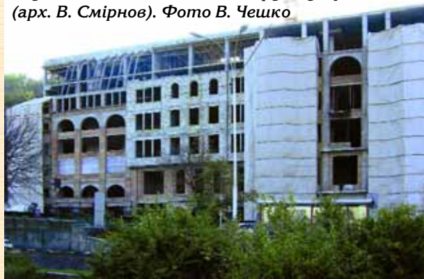
Готельний комплекс «поглинув» пам'ятку науки і техніки — київський фунікулер (арх. В. Смірнов).

спотворенню ще недавно прекрасного, славного своєю неповторною красою Києва — древньої столиці міст руських!