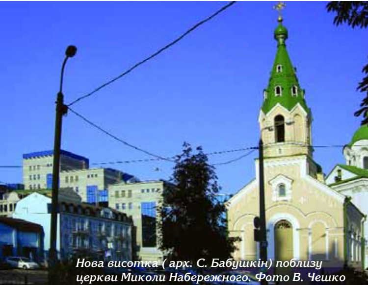
Нова висотка ( арх. С. Бабушкін) поблизу церкви Миколи Набережного.

XVIII ст. І. Григоровича-Барського завершено будівництво громіздкої, немасштабної до церкви і її оточення, споруди.