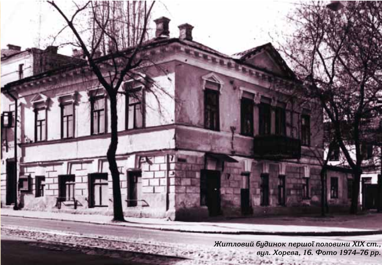
Житловий будинок першої половини XIX ст., вул. Хорева, 16. Фото 1974–76 рр.

призначались зустрічі, з басейну фонтана набиралась вода, яка надходила з Андріївської гори і вважалася чудодійною.