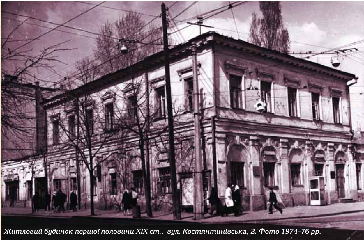
Житловий будинок першої половини XIX ст., вул. Костянтинівська, 2. Фото 1974–76 рр.

Втративши з середини XIX ст. значення загальноміського центру, Поділ все ж зберігає свою роль у розвитку ремесел та торгівлі. Риси класицизму зникають, натомість формуються особливості архітектури так званого “київського цегляного стилю”, що переважає в київському будівництві кінця XIX–початку XX ст.