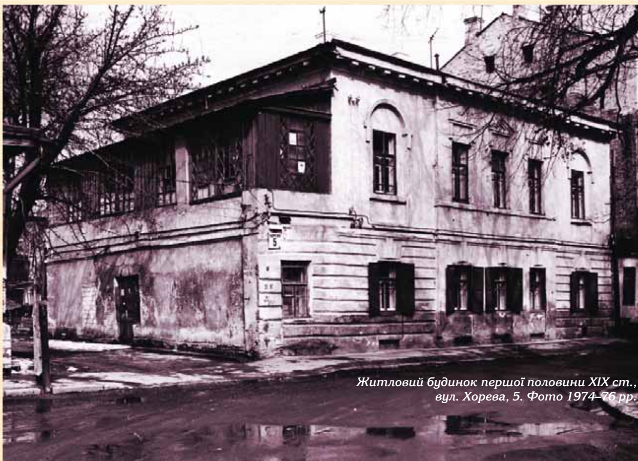
Житловий будинок першої половини XIX ст., вул. Хорева, 5. Фото 1974–76 рр.

Таким чином, будинки першої половини XIX ст., як і пам'ятки більш ранніх періодів, становлять значну пізнавальну цінність, заслуговують на дбайливе ставлення та потребують професійної реставрації.