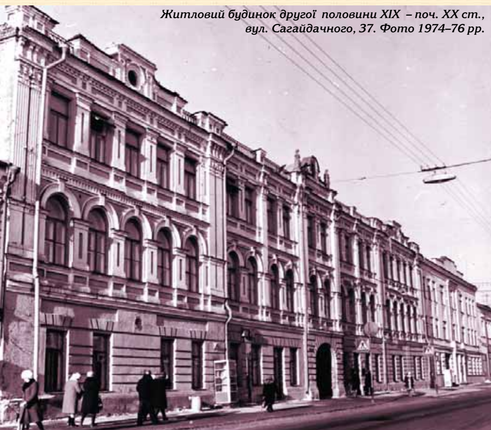
Житловий будинок другої половини XIX – поч. XX ст., вул. Сагайдачного, 37. Фото 1974–76 рр.

б) будівель, які мали історико-культурну цінність, а також тих, що могли бути рекомендовані до складу пам'яток архітектури — 168 (11,3) — ці будівлі підлягали збереженню;