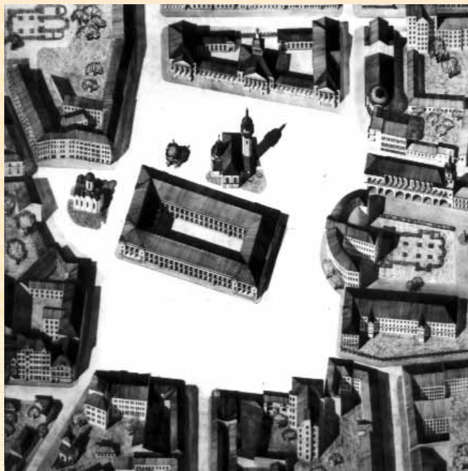
Проект реконструкції Червоної (Контрактової) площі на історичній основі. 1976 р.

Проїшов час, і за проектом регенерації площі було відтворено двоповерховий Гостиний двір, церкву Богородиці Пирогощії, фонтан “Самсон” з ротондою, дзвіницю Грецького монастиря, реставровано Контрактний будинок, Староакадемічний кор-