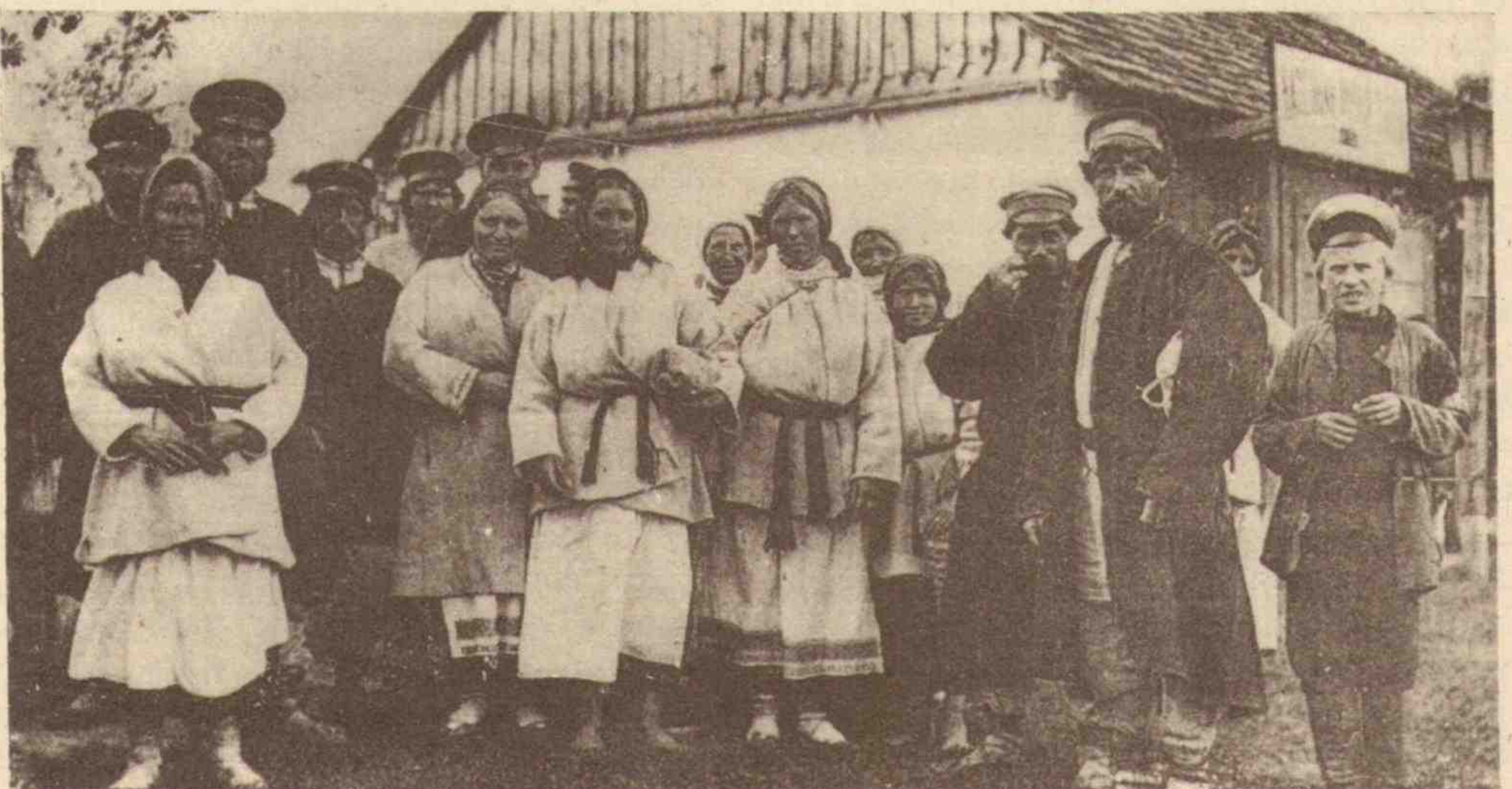
Селяни-поліщуки в м. Сорочи Волинської губернії. 1916 р.