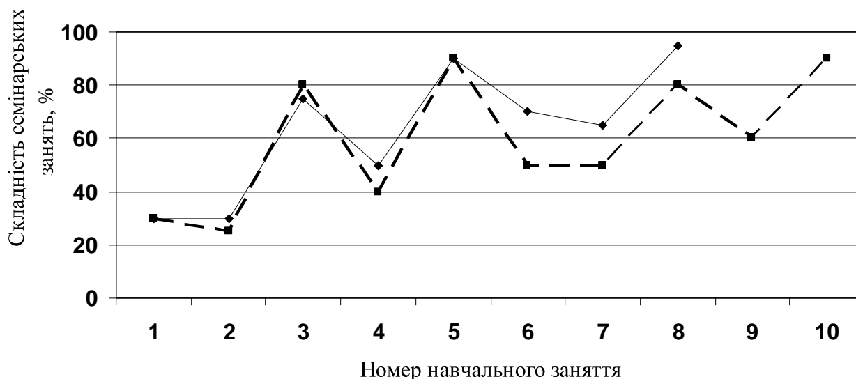
Рис. 2. Залежність складності семінарських занять від номеру навчального заняття

Залежність складності семінарів від номеру навчального заняття представлена на рис. 2 (пунктирна лінія – “П”). Як видно з рис. 2, семінарські заняття побудовані таким чином, що тренд складності поступово зростає з використанням хвильових залежностей [4, 11]. Цей підхід емпірично суб’єктивно позитивно обґрунтований студентами спеціальностей “Переклад” (дисципліна “Основи інформатики та прикладної лінгвістики”; вирішено класичну психологічну проблему використання студентами гуманітарних спеціальностей програмно-технічних засобів) та “Комп’ютерні науки” (дисципліна “Основи програмування та алгоритмічні мови”; студенти навчилися основам програмування середнього рівня у середовищі Delphi v. 7). Необхідно відзначити, що паралельно з нелінійно-хвильовим підходом для студентів спеціальності “Комп’ютерні науки” викладалася інша дисципліна “Об’єктно-орієнтоване програмування” з використанням класичної концепції лінійного росту складності семінарських занять. У порівнянні студентами емпірично позитивно відзначено методологію нелінійно-циклічної організації навчального процесу.